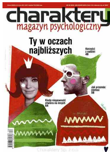
Ilustracja 3: „Charaktery”, nr 12/2013

pojawił się w 1 numerze z 2007 roku na okładce, w otoczeniu opisywanych informacji, była wysokość jednorazowego nakładu pisma. Sytuacja ta nie ulegała zmianom do końca 2009 roku. Dla zobrazowania pewnych zmian, które pojawiły się na pierwszej stronie periodyku posłużą Ilustracje 2 i 3, przedstawiające okładki z pierwszego i ostatniego numeru omawianego okresu.