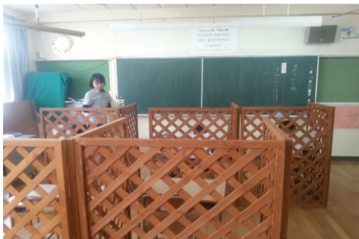
Fot. 8. Klasa szkolna – kyōshitsu (教室) w szkole ogólnodostępnej z klasami specjalnymi dla dzieci z zaburzeniami rozwoju – hattatsu shōgai (発達障) ze spectrum autyzmu