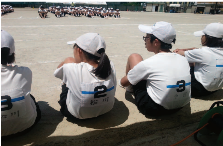
Fot. 9. Na boisku szkolnym uniwersyteckiej szkoły ogólnodostępnej z klasami inkluzyjnymi

ba pechowa a wymawiana jako ( shi し) budzi bliskie skojarzenia ze śmiercią.