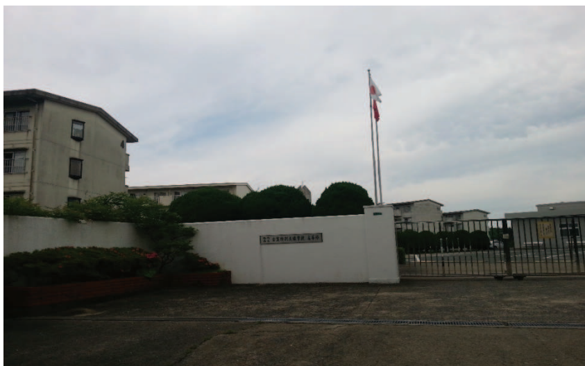
Fot. 1. Zespół Szkół Specjalnych Koga