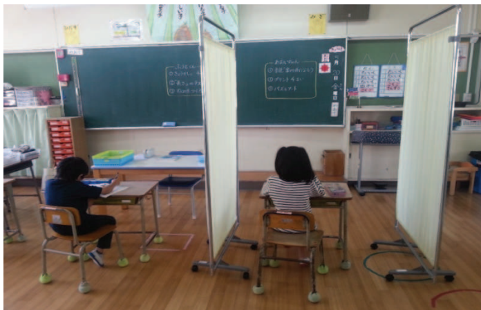
Fot. 7. Klasa szkolna – kyōshitsu (教室) w szkole ogólnodostępnej z klasami specjalnymi dla dzieci z zaburzeniami rozwoju – hattatsu shōgai (発達障) ze spectrum autyzmu