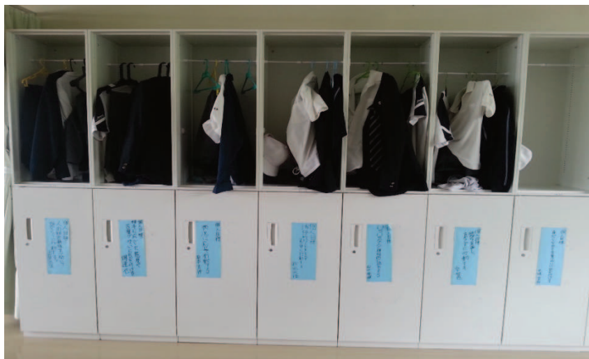
Fot. 4. Szafki w klasie lekcyjnej – tokushu gakkō (特殊学校)

Parawany są również stałym elementem i historycznie obecnym artefaktem kultury japońskiej. Nie zauważyłam aby dzieci kontaktowały się między sobą przez parawany różnego typu. Były zaabsorbowane własną pracą. Ciekawym miejscem szkół były biblioteki szkolne. W szkole ogólnodostępnej z klasami inkluzyjnymi i specjalnymi na korytarzu przed wejściem do biblioteki zamocowana była długa na ponad 3 metry, wielostanowiskowa umywalnia z kilkoma kranami, mydłami w plastikowych siatkach oraz przypomnieniem pisemnym z zaleceniem umycia rąk przed wejściem do biblioteki szkolnej. Hole przed biblioteką szkolną, podobnie jak genkan były drugim miejscem w przestrzeniach szkolnych, gdzie należało dokonać oczyszczenia.