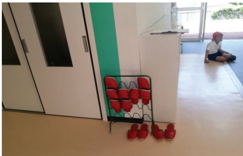
Fot. 2. Surippa (スリッパ) - klapki szkolne dla gości wiszą na specjalnym stojaku