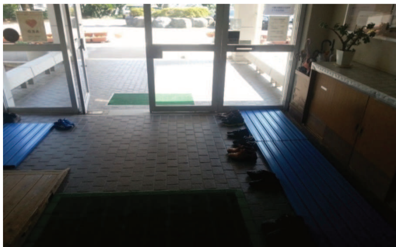
Fot. 3. Genkan (玄関)