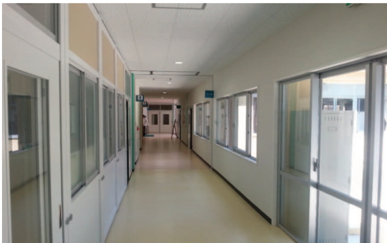
Fot. 5. Korytarz w szkole specjalnej – tokushu gakkō (特殊学校)