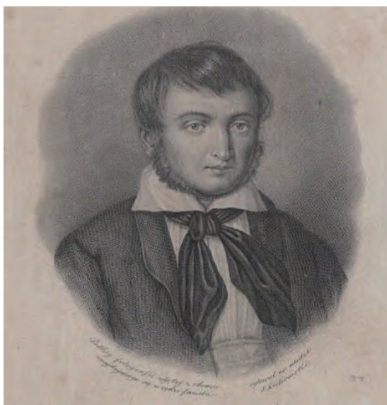
Maurycy Mochnacki

W okresie sporów romantyków z klasykami pojęcie „romantyczność” obejmowało równoległy i komplementarny wobec klasycyzmu typ literatury, spór miał zaś charakter estetyczny, a jego przedmiot stanowiły istotne zagadnienia teorii kultury i estetyki literackiej (wypowiedzi m.in. Śniadeckiego, Koźmiana, Osińskiego, Mickiewicza, Mochnackiego). Po powstaniu listopadowym pojęcie „romantyzm”