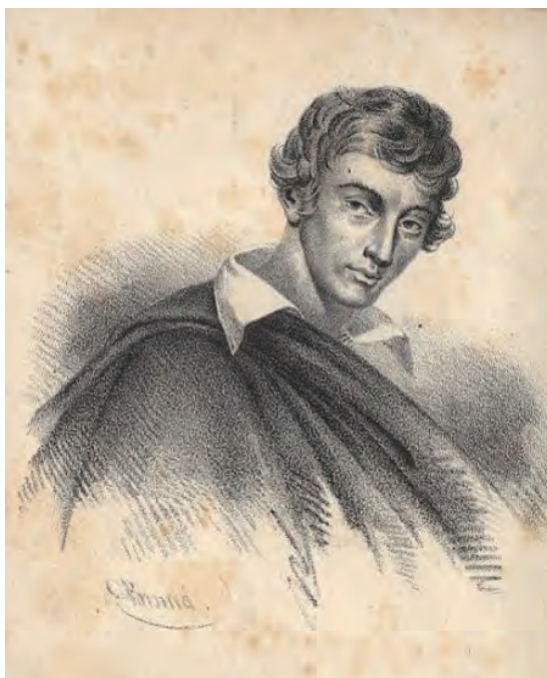
Adam Mickiewicz

Nieznaną dotąd w Polsce, oryginalną koncepcję poezji romantycznej zaproponował Mochnacki. Romantyczność stanowiła dla krytyka nazwę (cechę) typu literatury oraz walor literatury i kultury wieków średnich. Utożsamiał ją też z poetycznością, która była domeną nie tylko twórczości, ale i świata realnego (wpływ koncepcji poezji progresywnej Friedricha Schlegla). W rozprawach Mochnackiego określenie „romantyczny” miało wartość pozytywną. Twierdził on bowiem (tak jak i wielu innych romantyków), że romantyczność (romantyzm) dąży do ujawnienia wiedzy o współczesnym człowieku,