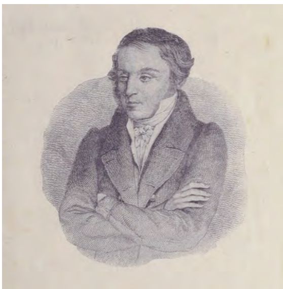
Kazimierz Brodziński

Na późniejsze rozumienie pojęcia „romantyzm” w polskiej krytyce literackiej miały również wpływ wystąpienia obrońców klasycyzmu, do których oprócz Jana Śniadeckiego należeli przede wszystkim Kajetan Koźmian i Ludwik Osiński. Reprezentantami nowego prądu i zarazem uczestnikami pierwszych polemik byli m.in. Michał Grabowski, Stefan Witwicki, Michał Podczaszyński, Jan Ludwik Żukowski, Józefat Bolesław Ostrowski, Ludwik Piątkiewicz i Walenty Chłędowski. W świadomości językowej XIX w., a zwłaszcza jego pierwszej połowy, wyrazy „romantyzm”, „romantyczność” i „romansowość” bardzo często identyfikowano jako synonimy.