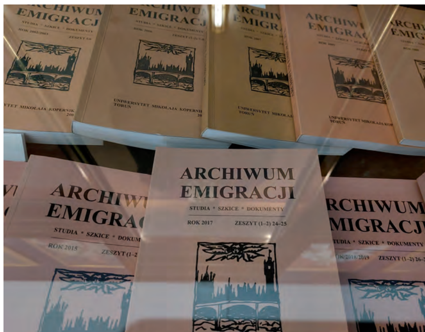
Fot. Marcin Lutomiński

dotyczące życia codziennego Polaków poza ojczyzną (m.in. rodzina, praca, wspólnoty, relacje międzygrupowe),