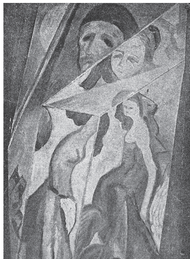
Il. 6. Tytus Czyżewski, Salome. Obraz wielopłaszczyznowy , ok. 1915–1919 r., praca zaginiona, repr. „Wiadki”, 1919, nr 1