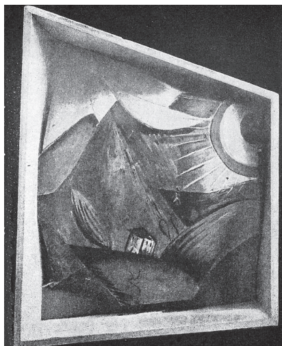
Il. 7. Tytus Czyżewski, Krajobraz ze słońcem . Obraz wielopłaszczyznowy, praca zaginiona, repr. L. Chwistek, Tytus Czyżewski a kryzys formizmu