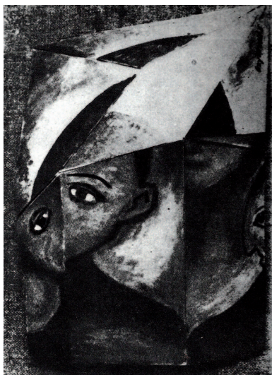
Il. 5. Tytus Czyżewski, Portret (Głowa). Obraz wielopłaszczyznowy , praca zaginiona, repr. „Nowości Ilustrowane”, 1917, nr 48