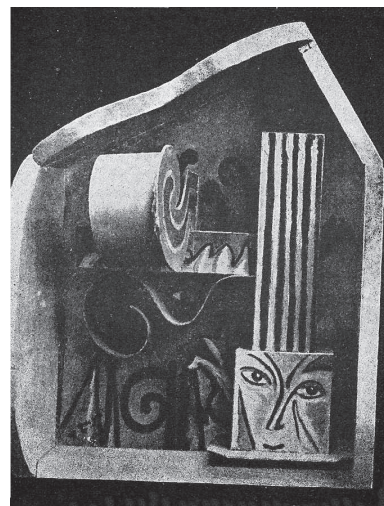
Il. 8. Tytus Czyżewski, Kompozycja form . Obraz wielopłaszczyznowy, ok. 1918 r., praca zaginiona, repr. L. Chwistek, Tytus Czyżewski a kryzys formizmu