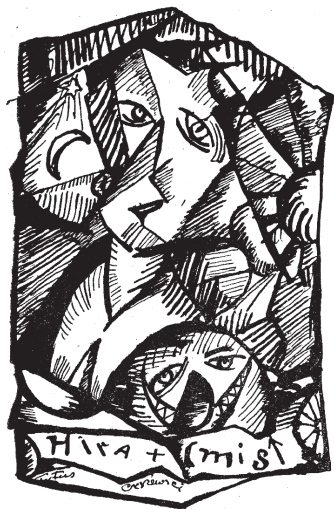
Il. 3. Tytus Czyżewski, Autoportret formistyczny , 1916 r., praca zaginiona, repr. „Formiści”, 1921, z. 4