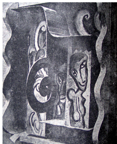
Il. 9. Tytus Czyżewski, Kompozycja form II . Obraz wielopłaszczyznowy, ok. 1920 r., praca zaginiona, repr. „Nowości Ilustrowane”, 1921, nr 12