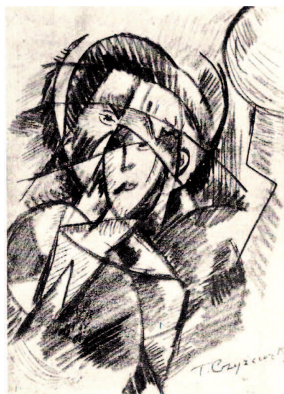
Il. 2. Tytus Czyżewski, Głowa , 1915 r., praca zaginiona, repr. „Głos Plastyków”, 1938, nr 8–12