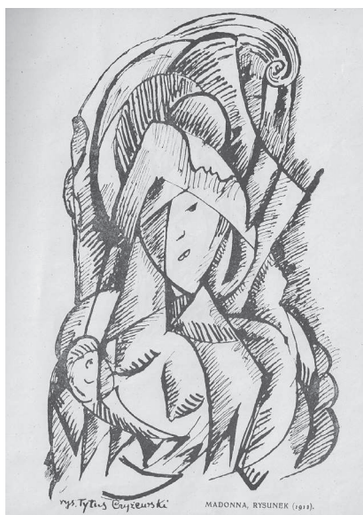
Il. 1. Tytus Czyżewski, Madonna , 1911 r., praca zaginiona, repr. L. Chwistek, Tytus Czyżewski a kryzys formizmu , Kraków 1922

Obrazy wielopłaszczyznowe Czyżewskiego, malowane najpierw na płótnie lub tekturze, a później konstruowane z różnych elementów, były najodważniejszym eksperymentem w ówczesnej sztuce polskiej. Stanowiły przykład modyfikacji tradycyjnej idei obrazu, a jednocześnie pokazywały potrzebę przekraczania granic między gatunkami, charakterystyczną dla twórców z kręgu awangardy.