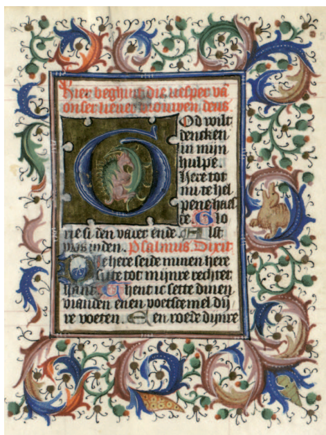
Il. 7. Modlitewnik 83/I, f. 53 r (karta ukończona). Bordiura z tłem wypełnionym malachitowymi gałązkami, zakończonymi pączkami ostu; inicjał duży na złotym tle, z motywem hybrydy