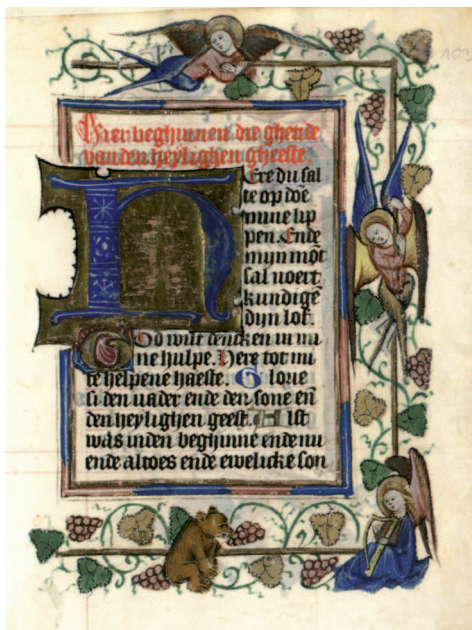
Il. 4. Modlitewnik 83/I, f. 103 r (karta ukończona). Bordiura z wici winnej latorośli wokół złotej listwy, z wplecionymi półpostaciami serafinów, w bas-de-page muzykujący anioł oraz niedźwiedź