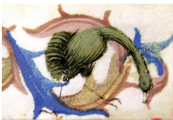
Il. 20. Modlitewnik 83/I, f. 2 r (karta nieukończona) – fragment. Postać ptaka, opracowana za pomocą pospiesznego kreskowania, nogi i dziób pozostawione w fazie szkicu