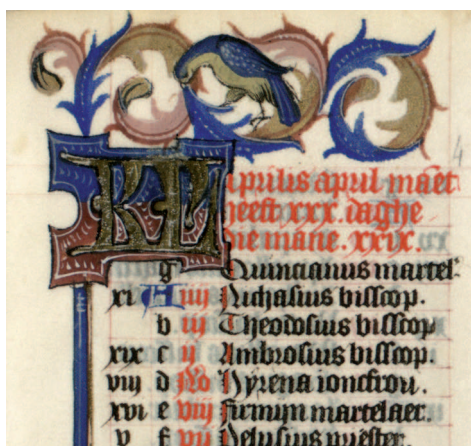
Il. 6. Modlitewnik 83/I, f. 4 r (karta nieukończona?) – fragment. Inicjał średni w ramce, litera złożona, tło malowane gwaszem; liście akantu wykończone w pełni; dziób ptaka nieukończony