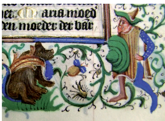
Il. 11. Modlitewnik 83/I, f. 40 r (karta ukończona) – fragment. Postać niedźwiadka wykończona czarną kreską, detale postaci niedźwiedznika uzyskane bielą