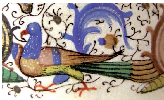
Il. 18. Modlitewnik 83/I, f. 22 v (karta ukończona) – fragment. Postać pawia malowana wielobarwnie gwaszem i wykończona czarnym konturem; tło bordiury pomiędzy akantami wypełnione piórkową „pajęczynką”