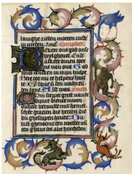
Il. 17. Modlitewnik 83/I, f. 126 v (karta nieukończona) – fragment. Naniesiona kolorystyczna kompozycja akantu bez wykończenia, brak wypełnienia tła, wykończone motywy drolerie