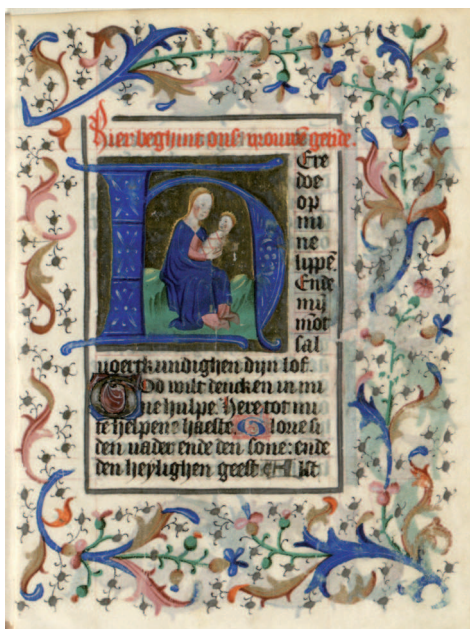
Il. 1. Modlitewnik 83/I, f. 12 r (karta ukończona). Karta incipitowa z inicjałem figuralnym

zostaje również bez odpowiedzi, choć jednolitość oddziaływania całości, luksusowe materiały i hierarchizacja dekoracji świadczą o tym, że manuskrypt z powodzeniem mógł być przez warsztat sprzedany i funkcjonować w prywatnym ususie dewocyjnym.