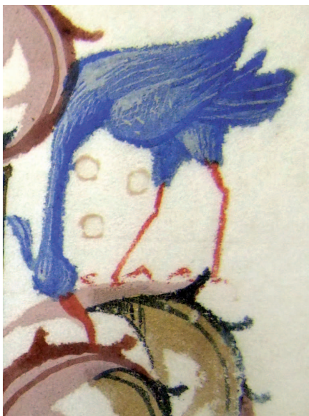
Il. 13. Modlitewnik 83/I, f. 126 v (karta nieukończona) – fragment. Nieukończona postać czapli z wmalowanymi białymi piórkami, widoczne projekty złotych ziarenek w tle