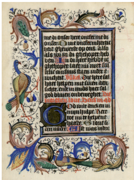
Il. 2. Modlitewnik 83/I, f. 22 v (karta ukończona). Duży inicjał na złotym polu; wykończona bordiura z liści akantu, z drobnym piórkowym ornamentem w tle, z motywem szyszek w narożach i z wplecionymi postaciami rajszych ptaków