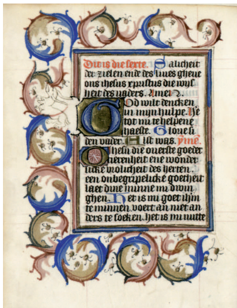
Il. 10. Modlitewnik 83/I, f. 90 v (karta nieukończona). Kompozycja akantowa bez wykończenia, z rozpoczętym, piórkowym wypełnieniem tła pomiędzy liśćmi akantu oraz pozostawionym w fazie szkicu motywem smoka