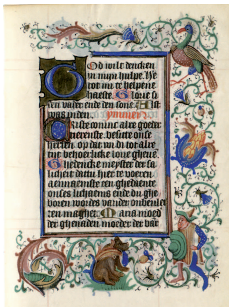
Il. 3. Modlitewnik 83/I, f. 40 r (karta ukończona). Duży inicjał na złotym polu, inicjał średni w ramce oraz drobne inicjały kaligraficzne; wykończona w całości bordiura z liści akantu, tło wypełnione zieloną wicią roślinną, uzupełnioną ornamentem piórkowym, z motywem szyszki, strączka oraz motywami figuralnymi: rajski ptak, niedźwiedź i niedźwiedźnik