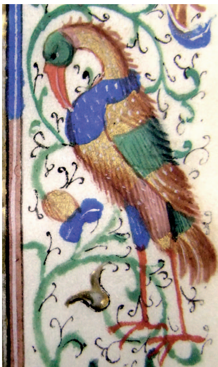
Il. 21. Modlitewnik 83/I, f. 61 r (karta ukończona) – fragment. Postać ptaka, nogi i dziób malowane po ukończeniu piórkowego ornamentu w tle