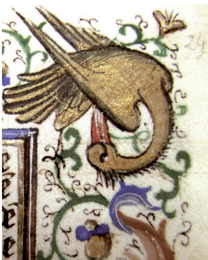
Il. 22. Modlitewnik 83/I, f. 24 r (karta ukończona, bez drobnych detali) – fragment. Postać ptaka malowana sproszkowanym złotem i wykończona czarnym konturem, lewa noga ptaka w fazie szkicu, prawa ukończona pospiesznie piórkem, bez uwzględnienia wcześniejszego projektu