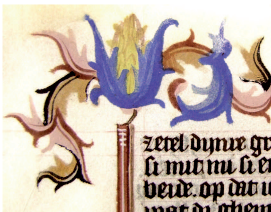
Il. 16. Modlitewnik 83/I, f. 76 v (karta nieukończona) – fragment. Nieukończony ornament akantowy z motywem szyszki (bez wykończenia)