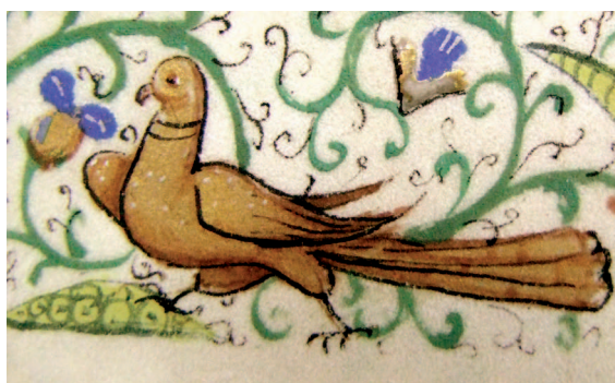
Il. 19. Modlitewnik 83/I, f. 24 r (karta ukończona) – fragment. Postać pawia malowana sproszkowanym złotem i wykończona czarnym konturem