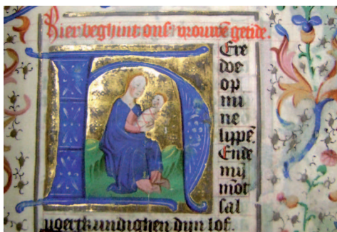
Il. 8. Modlitewnik 83/I, f. 12 r (karta ukończona) – fragment. Inicjał figuralny z Matką Bożą z Dzieciątkiem