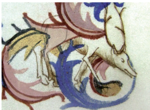
Il. 15. Modlitewnik 83/I, f. 59 r (karta nieukończona) – fragment. Szkic postaci jelenia z próbą cieniowania, dukt liści akantu celowo przerywany