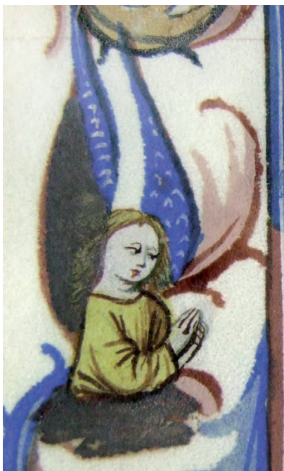
Il. 12. Modlitewnik 83/I, f. 92 v (karta nieukończona) – fragment. Półfigura anioła, wyjątkowo wprowadzona w obręb bordiury akantowej