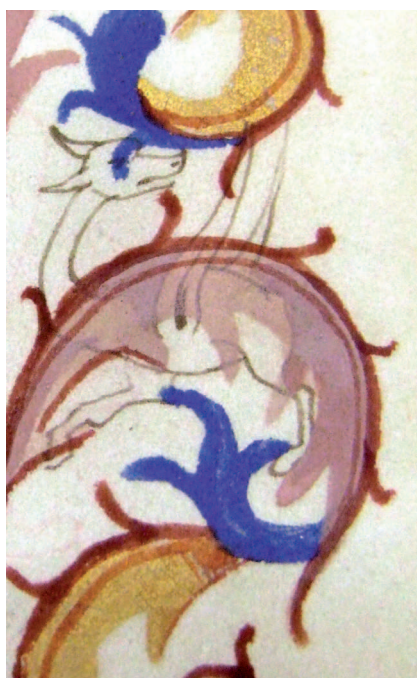
Il. 14. Modlitewnik 83/I, f. 59 r (karta nieukończona) – fragment. Szkic postaci smoka, naniesiony ugrowym konturem, przykryty liśćmi akantu