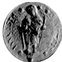
Św. Jakub na pieczęci miejskiej Pakości z 1596 r.

Św. Jakub Większy zanim pojawił się w herbie Pakości trafił najpierw na pieczęcie miejskie. Najstarsza znana nam pieczęć Pakości pochodzi z połowy XVI w. Dokładnie znamy ją z dokumentu wystawionego w 1554 r. Jej pole wypełnia osoba z laską pielgrzyma trzymaną w lewej ręce. Takie przedstawienie pozwala nam na identyfikację tej postaci ze św. Jakubem Większym. Podobne przedstawienia spotykamy na pieczęciach z XVII i XVIII w. Na stosunkowo dobrze zachowanym odcisku pieczęci, datowanym na 1678 r., możemy nawet zobaczyć, że przedstawiony tam święty trzyma w prawej ręce przedmiot, którym podobny jest do muszli. To jeszcze bardziej wzmacnia identyfikację postaci świętego z pieczęci ze św. Jakubem Większym. Możemy założyć, że św. Jakub pojawił się na pieczęciach miejskich już w XIV w., najpewniej krótko po nadaniu Pakości praw miejskich, czyli po 1359 r. 19