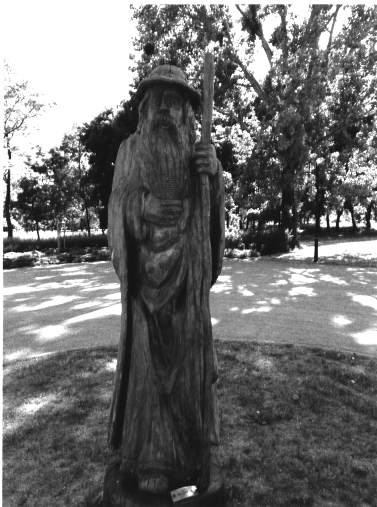
Pakość, rzeźba św. Jakuba Większego przy budynku informacji turystycznej.