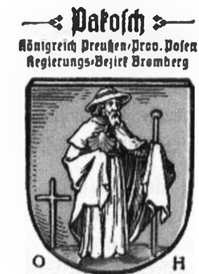
Św. Jakub na znaczku reklamowym z 1915 r.