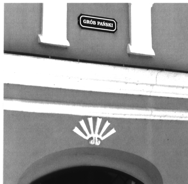
Pakość, muszla nad wejściem do kaplicy Grobu Pańskiego.