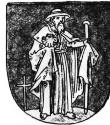
Św. Jakub w herbie miasta do 1906 r.