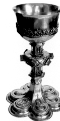
Kielich z kościoła św. Jakuba.