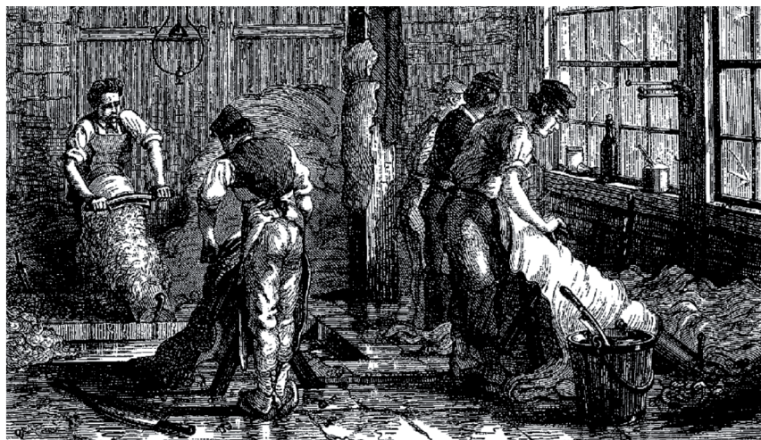
Il. 1. Proces odmięśniania i odwłosiania skór ręcznie na tzw. kłodach, za: L. Figuiet (1819–1894), Les Merveilles de l'industrie ou description des principales industries modernes. Industries Chimiques: le sucre – le papier – les papiers peints – les cuirs et les peaux – le caoutchouc et la gutta-percha – la teinture , Paris 1873–1877, Jouvett et C ie , s. 377