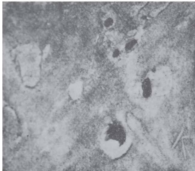
Il. 4. „Przeżarcie” skóry bydłowej spowodowane przez bakterie gnilne obecne w tzw. starej wapnicy (skóra jest w niej umieszczana podczas procesu tzw. wapnienia), za: Z. Kowalski, op. cit., s. 174