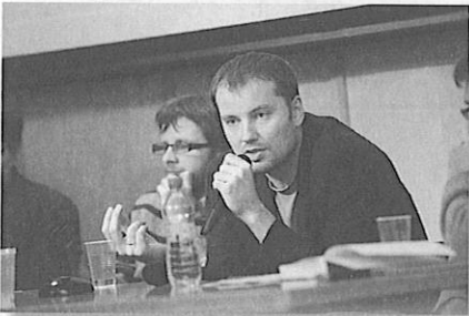
Dyskusja wokół książki B. Kuźniarza w Bibliotece Uniwersytetu Warszawskiego

W 1994 r. Fundacja zainicjowała serię Monografie FNP , w której publikowane są wyłaniane w drodze konkursu interesujące prace z dziedziny humanistyki i nauk społecznych. Fundacja zapewnia laureatom pokrycie kosztów wydania książki w serii oraz honorarium. O wysokim poziomie edytorskim i merytorycznym świadczą nagrody dla serii (Złote Pióro Fredry, Atena) oraz liczne nagrody i wyróżnienia indywidualne.