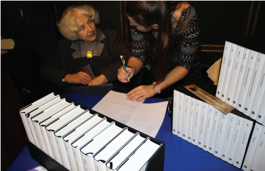
13. Premierowa sprzedaż Dzieł zebranych