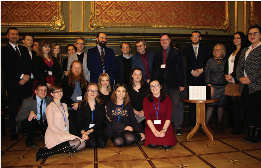
12. Pamiątkowe zdjęcie zespołu, który pracował nad edycją