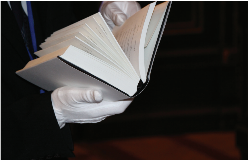
14. Dzieła zebrane w edycji limitowanej (oprawa twarda)