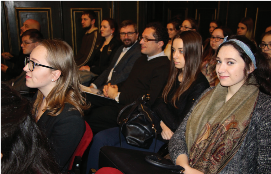
9. Do Dworu Artusa przybyło wielu słuchaczy