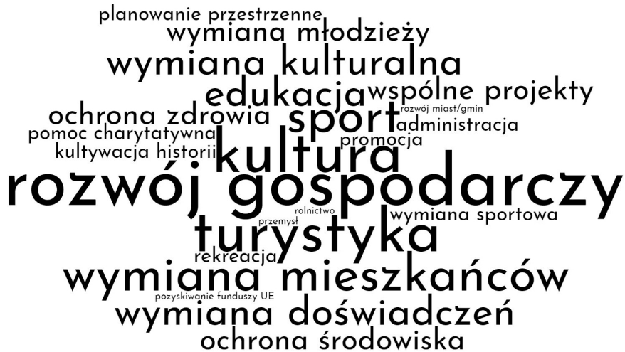
Ryc. 4. Chmura słów ilustrująca częstość występowania dziedzin współpracy w umowach partnerskich badanych miast (stan na 2017 r.)