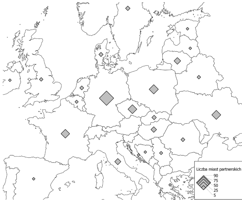
Ryc. 3. Liczba zawartych umów partnerskich przez badane miasta według krajów Europy (stan na 2017 r.)