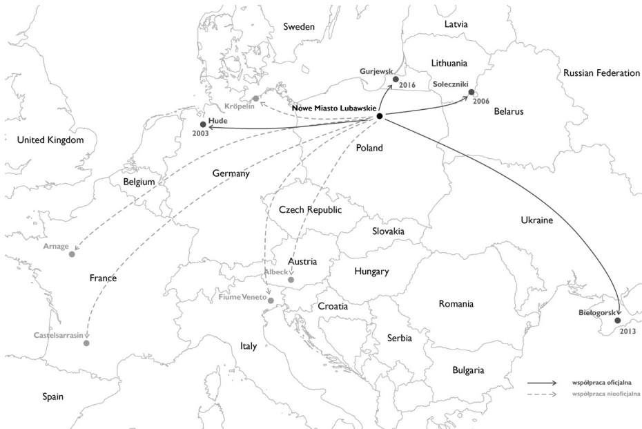
Ryc. 5. Mapa partnerów międzynarodowych Nowego Miasta Lubawskiego