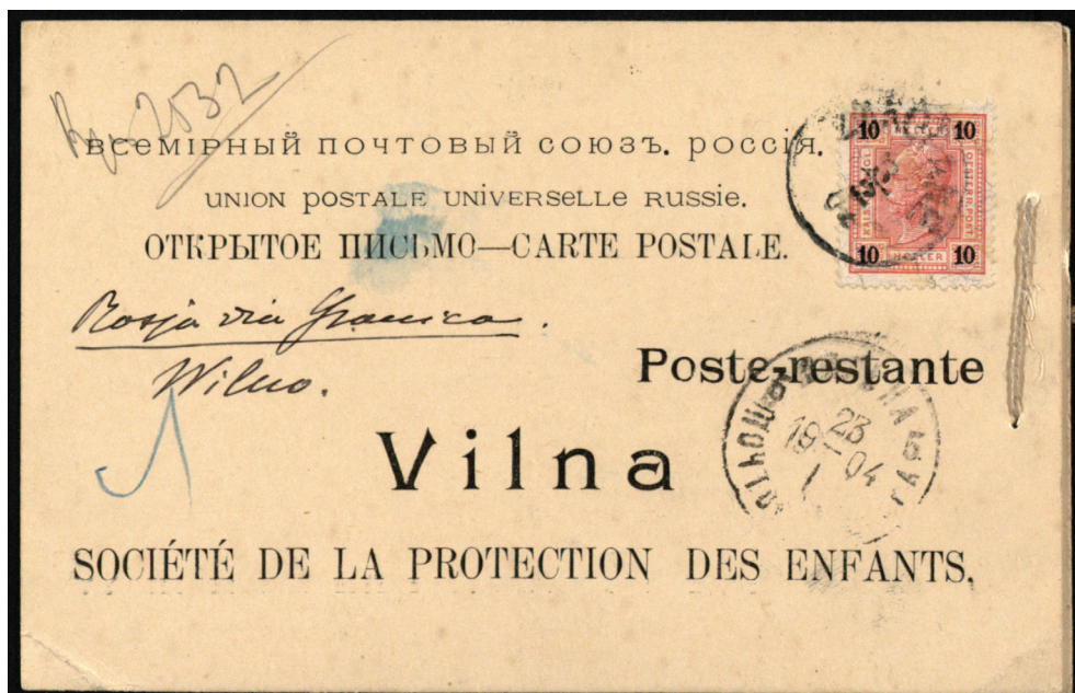
Awers karty korespondencyjnej z drugim aforyzmem Witkiewicza.

Sentencje skierowane do tego samego, zbiorowego adresata (Wileńskiego Towarzystwa Opieki nad Dziećmi) 3 , z identyczną datą wysyłki na stemplu pocztowym (23 I 1904), tworzą myślową całość. Pierwszy z fragmentów stanowi jakby credo człowieka, który przez całe życie służył sprawie jedności narodowej, drugi – jest tego wyznania uszczegółowieniem, przywołującym symboliczne pejzaże dawnej Rzeczypospolitej 4 . Oba zawierają swego ro-