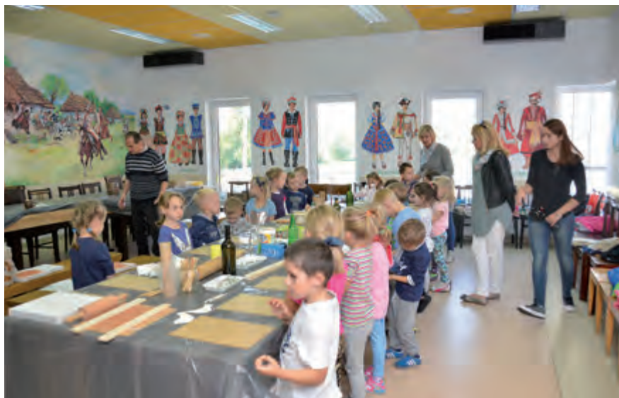
Uczestnicy warsztatów sztuki garncarskiej z cyklu „Ginące zawody” w świetlicy środowiskowej CEM (2017.10.02)