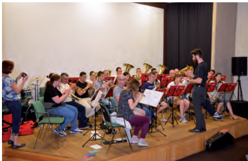
Koncert Orkiestry Dętej OSP z Miejsca Piastowego (2017.05.19)