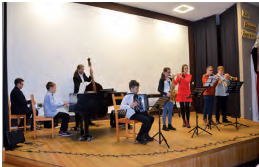
Świąteczny koncert Szkoły Muzycznej (2017.12)