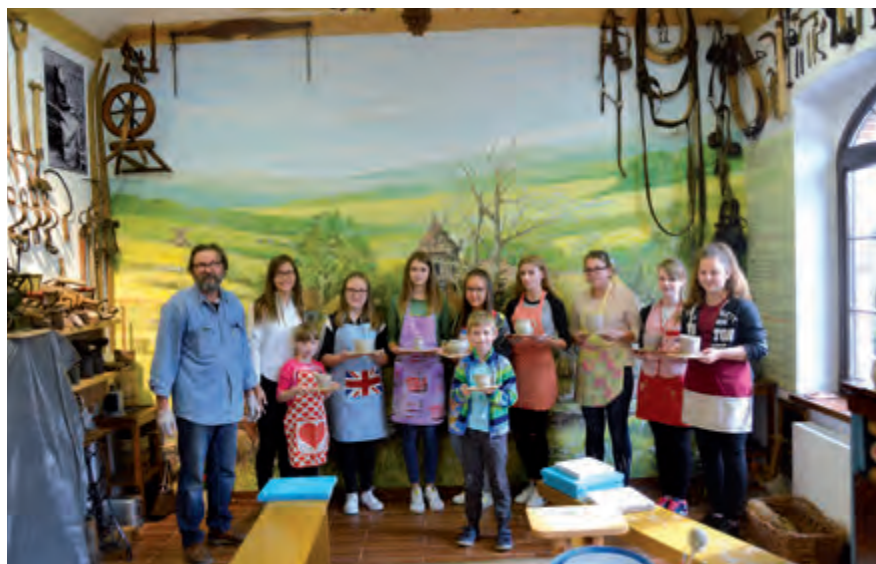
Uczestnicy warsztatów sztuki garncarskiej z cyklu „Ginące zawody” (2017.10.03)