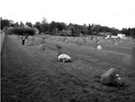
Płock Trzepowo 2012 r., Smoleński Park Pamięci