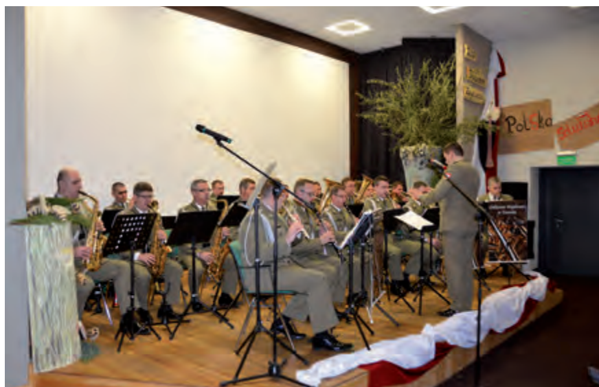
Koncert patriotyczny orkiestry wojskowej z Torunia (2017.11.13)