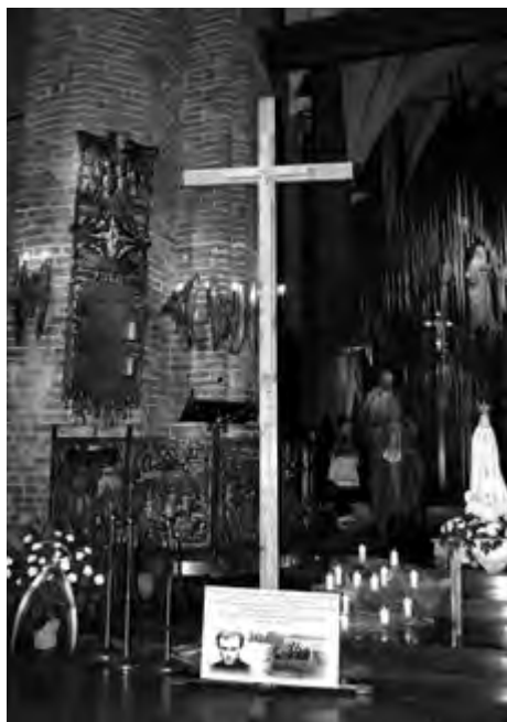
Gdańsk 2016 r.