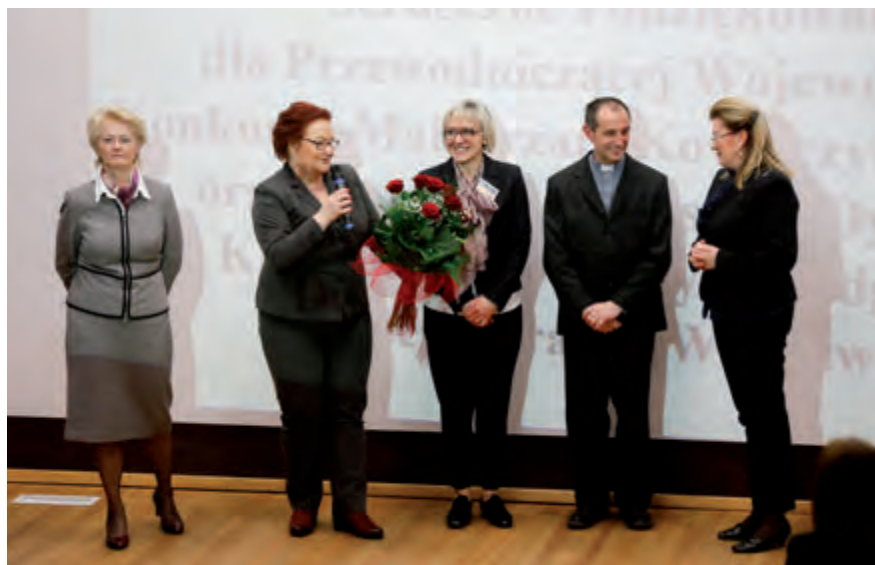
Gala rozdania nagród Konkursu o Wielkich Polakach „Św. Jan Paweł II w województwie kujawsko-pomorskim – obecność i dziedzictwo” (2017.04.06)