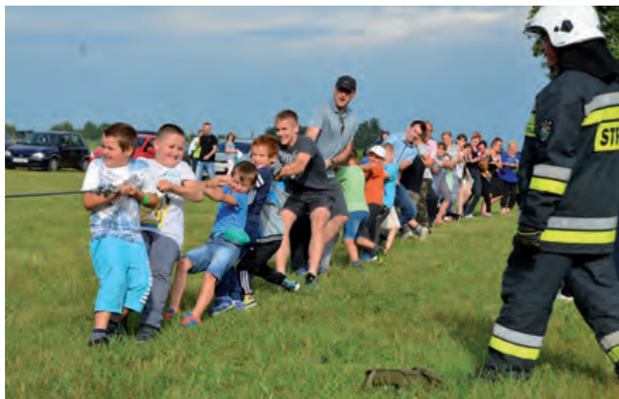
Piknik Rodzinny, który odbył się na boisku sportowym (2017.06.25)