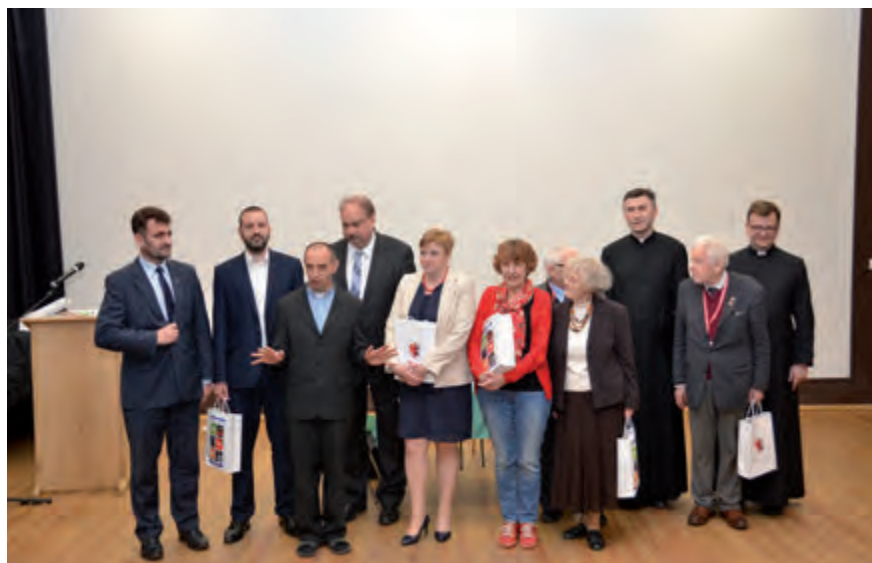
Prelegenci III Sympozjum naukowego w Centrum Edukacji Młodzieży pt. „Pielgrzymki i miejsca pielgrzymowania w Polsce w XX i XXI wieku” (2017.05.25)