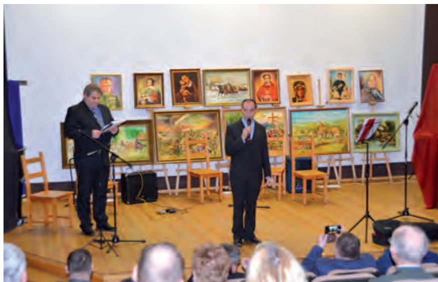
Aukcja charytatywna na rzecz CEM (2017.12.16)