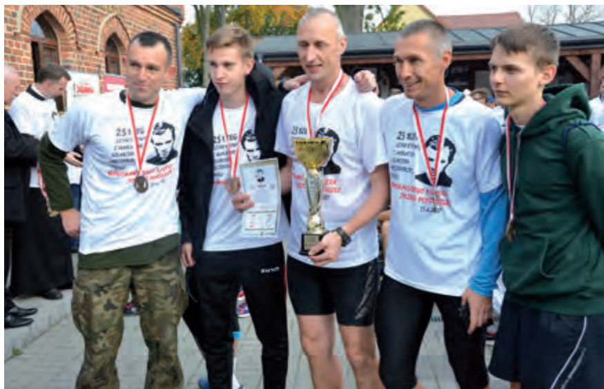
Jubileuszowy 25. Bieg sztafetowy i maraton ks. Jerzego Popiełuszki, na trasie z Bydgoszczy do Górška (2017.10.15)