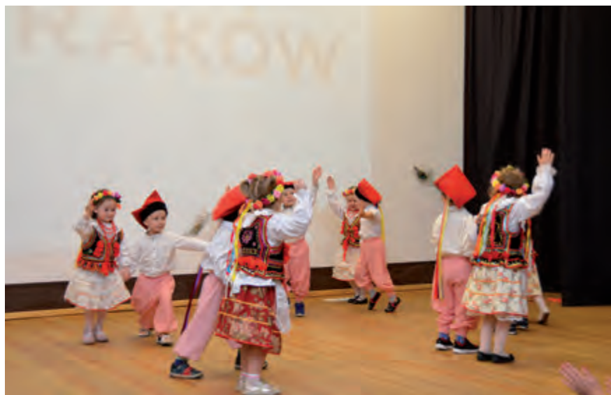
Gminne Przedszkole w Złejwsi Małej przygotowało koncert pt. „Rok rzeki Wisły” (2017.05.30)