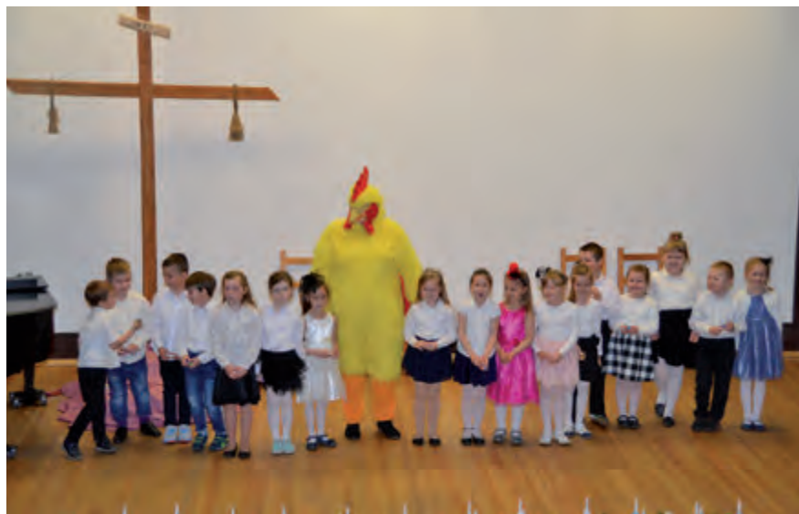
Występ dzieci ze szkoły w Górsku, który odbył się w trakcie Kiermaszu Wielkanocnego (2017.04.09)