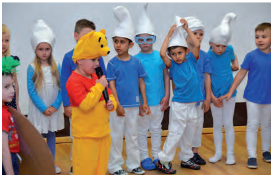
Dzieci z Przedszkola „Jagoda” przygotowali występ z okazji Dnia Matki i Ojca (2017.05.26)