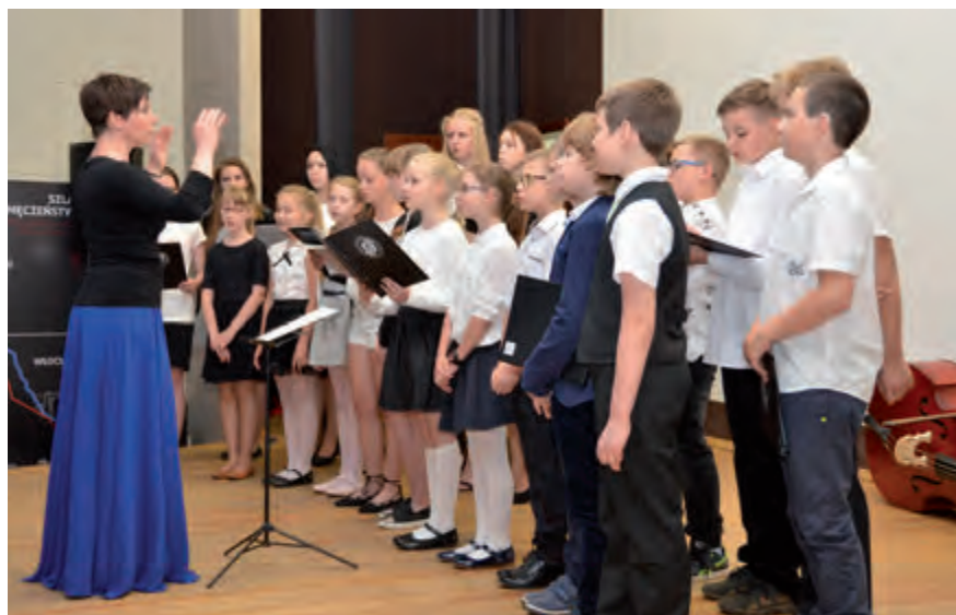
Koncert z okazji Dnia Matki, zorganizowany przez dzieci z Publicznej Szkoły Muzycznej I st. w Górsku (2017.05.25)