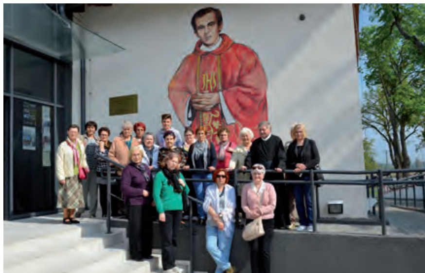
Przyjazd Rodziny Radia Maryja ze Szczecinka (2017.05.16)