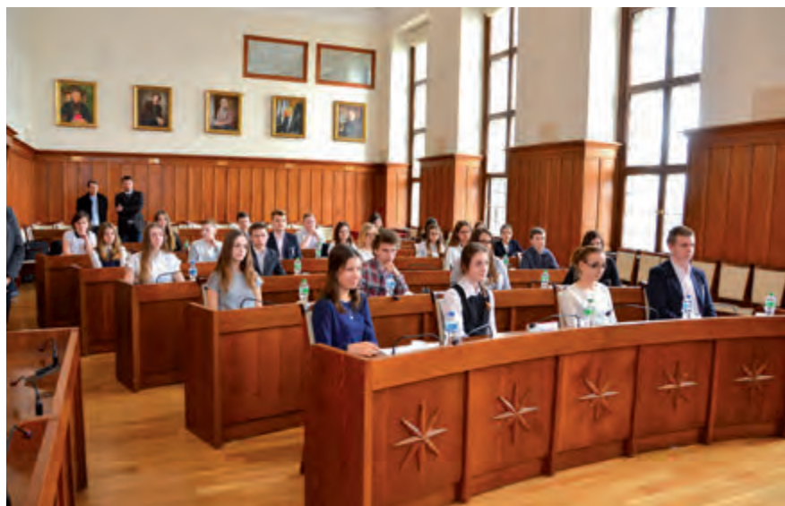
III etap – finał Wojewódzkiego Konkursu o Wielkich Polakach (2017.03.16)