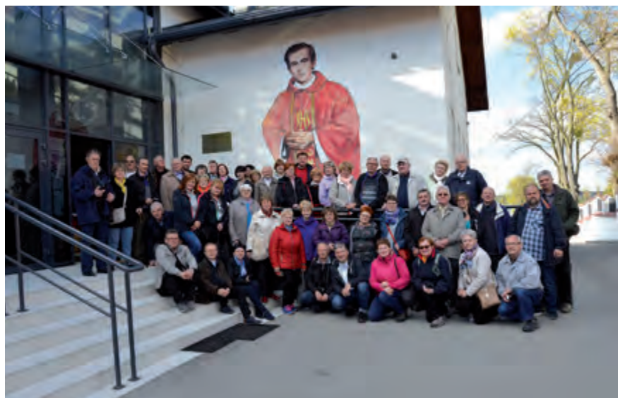
Grupa parafialna z Jastrzębia-Zdroju, Parafii NSPJ (2017.04.30)