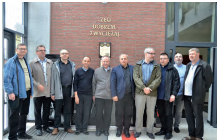
W CEM gościliśmy jubilatów 25-lecie kapłaństwa OO. Redemptorystów (2017.06.07)