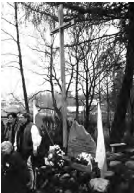
Zakopane – Jaszczurówka X.1998 r.