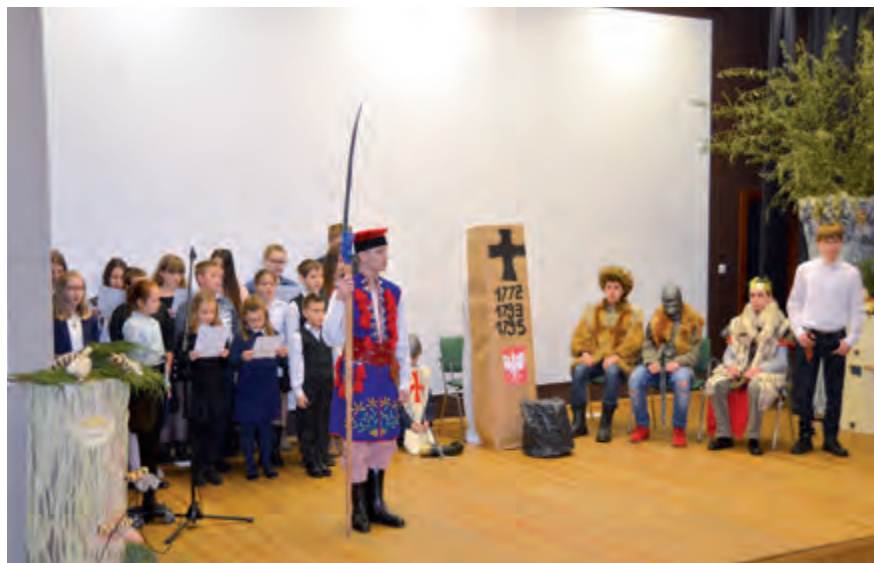
III Konfrontacje teatralne – występ teatru z Górską (2017.11)