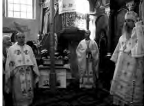
Ukraina 2013 r.