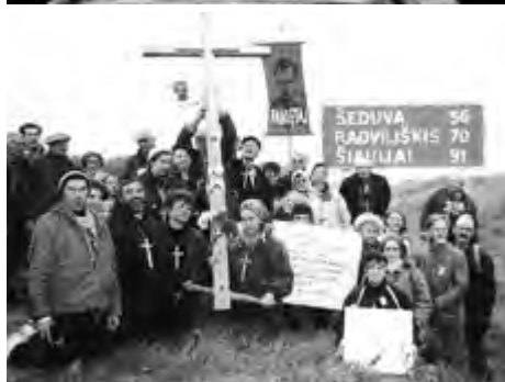
W drodze przez Litwę do Szawli, X.1994 r.