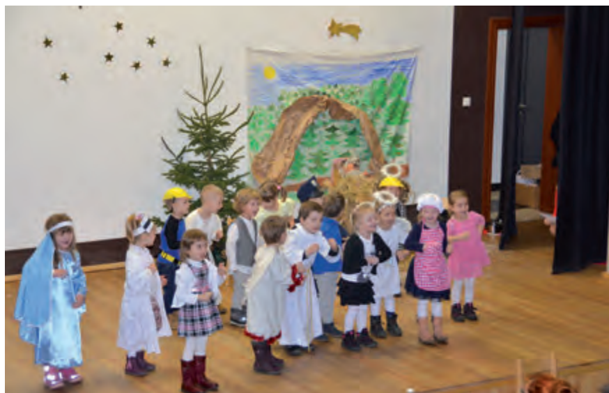
Jasełka w wykonaniu dzieci z Przedszkola „Jagoda” (2017.12.21)