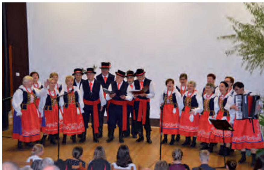
IV Przegląd Zespołów Śpiewaczych z okazji Europejskich Dni Dziedzictwa (2017.09.16)