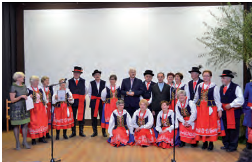
Uczestnicy IV Przeglądu Zespołów Śpiewających z okazji Europejskich Dni Dziedzictwa (2017.09.16)