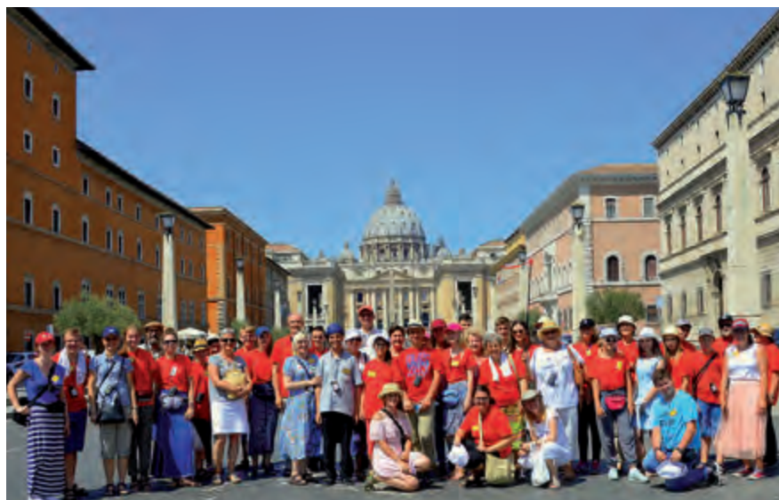
Laureaci Międzynarodowego Programu Edukacyjnego dla młodzieży „Śladami św. Jana Pawła II” na tle Watykanu (2017.08.04–12)