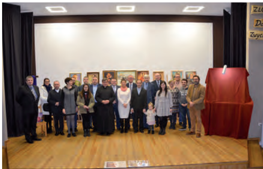
Koncert charytatywny, Opłatek, wystawa wyrobów w glinie i aukcja obrazów (2017.12.16)