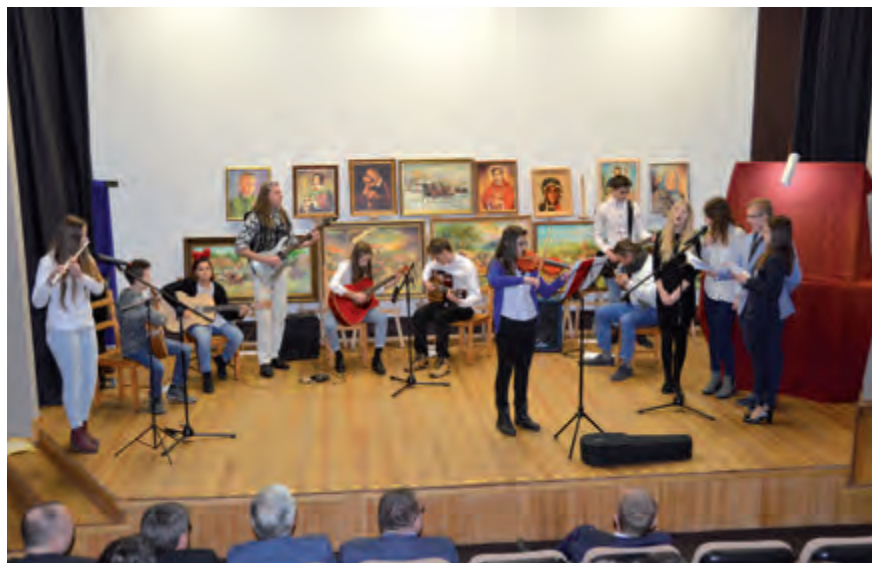
Koncert charytatywny zespołu „Ave” (2017.12.16)