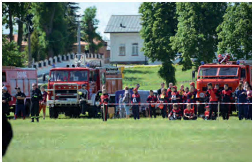
Na boisku odbyły się Strażackie Zawody Gminne, w których wzięło udział osiem jednostek straży pożarnej (2017.06.03)