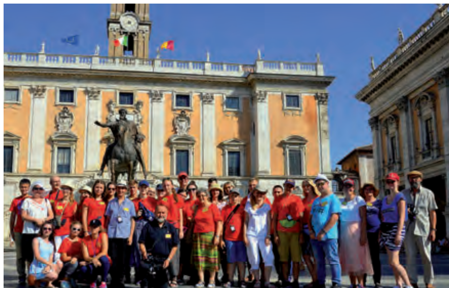
Na Kapitolu laureaci i uczestnicy Międzynarodowego Programu Edukacyjnego dla młodzieży „Śladami św. Jana Pawła II” (2017.08.04–12)