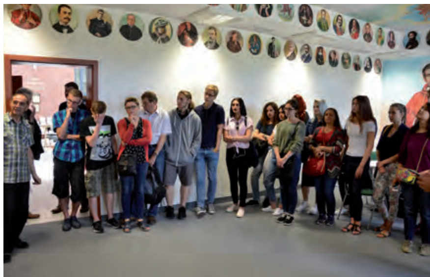
Uczestnicy Letniej Szkoły Języka i Kultury Polskiej dla Cudzoziemców. Zwiedzający przyjechali z takich krajów jak: Białoruś, Rosja, Gruzja, Norwegia, Brazylia, Kanada, Portugalia, Serbia, Chorwacja, Wielka Brytania, Irlandia, Bułgaria (2017.07.15)