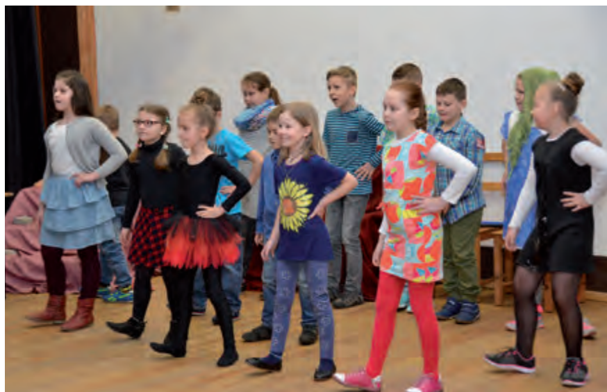
Przedstawienia wystawione przez uczniów szkoły w Górsku w trakcie Kiermaszu Wielkanocnego (2017.04.09)