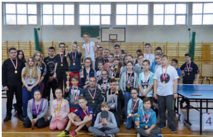
Zawody w tenisa stołowego zorganizowane przez Fundację Centrum Edukacji Młodzieży w Górsku (2017.12.02)