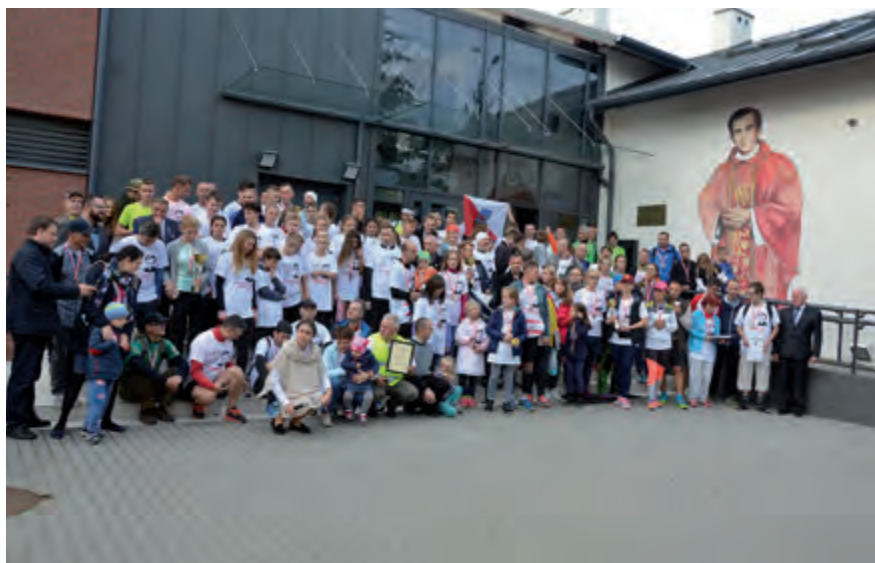
Uczestnicy Jubileuszowego 25. Biegu sztafetowego i maratonu ks. Jerzego Popiełuszki, na trasie z Bydgoszczy do Górška (2017.10.15)