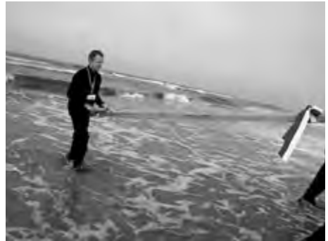
Dębki 2014 r. – zaślubiny Krzyża z Bałtykiem