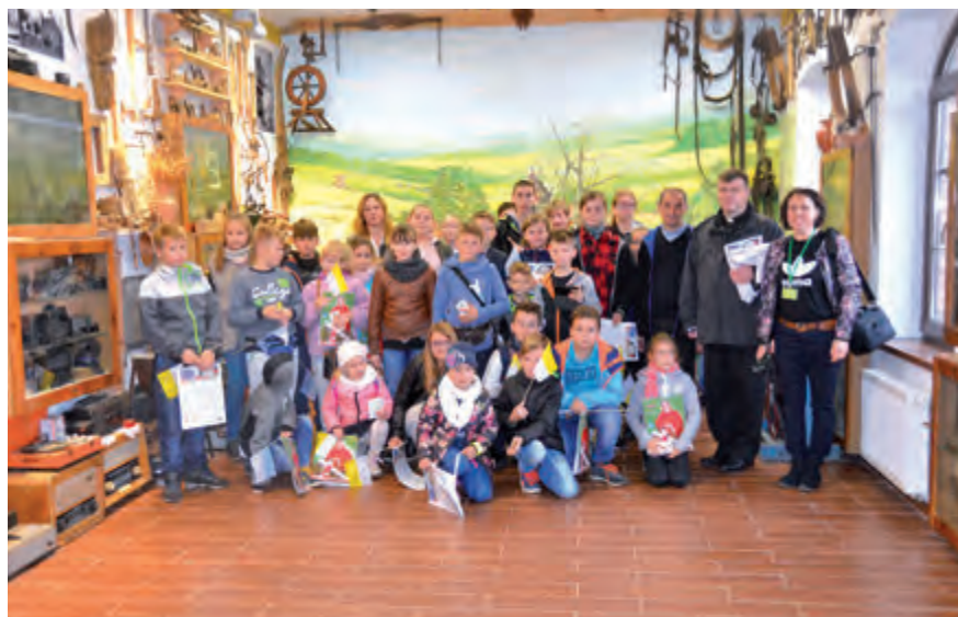
Grupa ze Świerczynek z wizytą w CEM, w nagrodę za uczestnictwo w konkursie (2017.10.19)