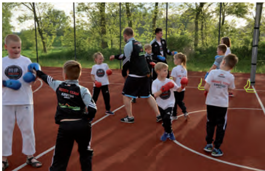
Trening karate na świeżym powietrzu (2017.05.27)