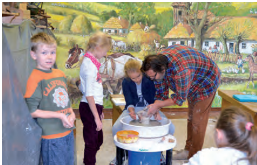
Warsztaty sztuki garncarskiej z cyklu „Ginące zawody” – wytwarzanie wyrobów z gliny (2017.10.12)