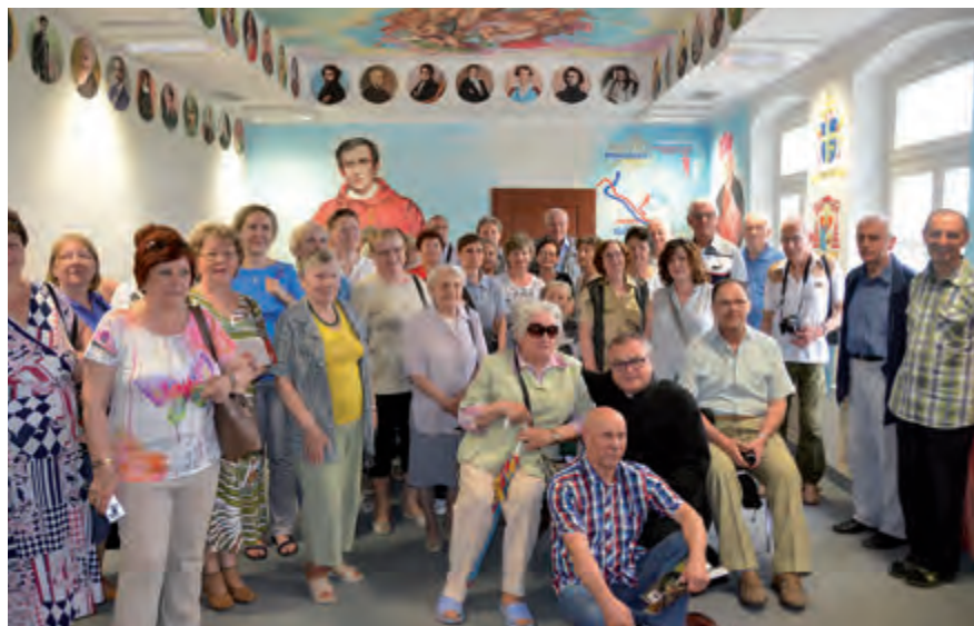
Pielgrzymka z Parafii św. Franciszka z Asyżu w Łodzi (2017.05.29)