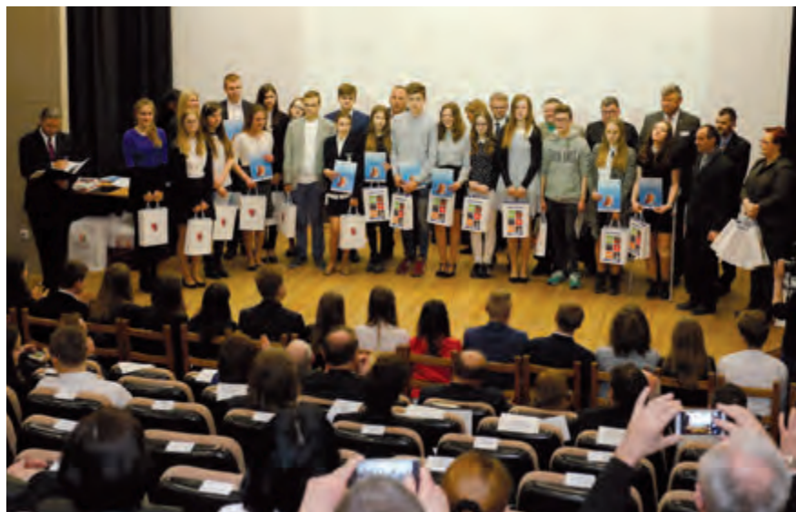
Laureaci, finaliści, organizatorzy i opiekunowie w czasie Gali rozdania nagród w Konkursie o Wielkich Polakach „Św. Jan Paweł II w województwie kujawsko-pomorskim – obecność i dziedzictwo” (2017.04.06)