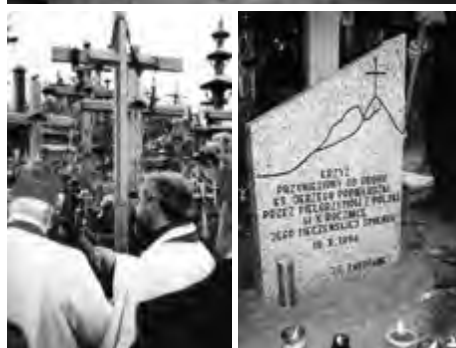
Góra Krzyży w Szawlach na Litwie, 19.X.1994 r.