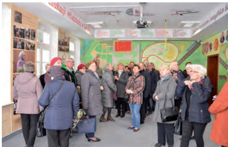
Wycieczka z Mławy, którą zorganizowało Stowarzyszenie Pontyfikat Papieża Jana Pawła II (2017.04.22)