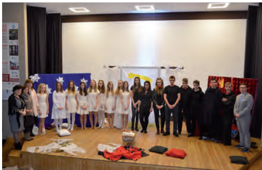
Występ uczniów w Centrum Edukacji Młodzieży w Górsku (2017.12.17)