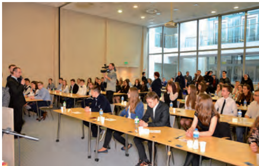
Uczestnicy III etapu Wojewódzkiego Konkursu o Wielkich Polakach w Urzędzie Marszałkowskim województwa kujawsko-pomorskiego w Toruniu (2017.03.16)