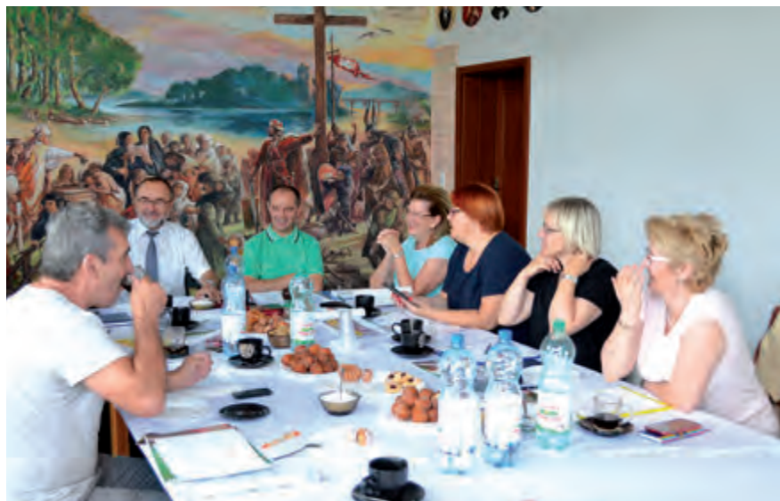
Spotkanie organizacyjne Wojewódzkiego Interdyscyplinarnego Konkursu Wiedzy o Wielkich Polakach w sali św. Jana Pawła II w Górsku (2017.08.31)