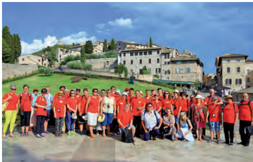
W Asyżu – laureaci i uczestnicy Międzynarodowego Programu Edukacyjnego dla młodzieży „Śladami św. Jana Pawła II” (2017.08.04–12)