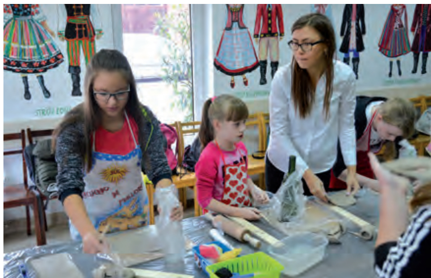
Młodzież z opiekunami w czasie warsztatów sztuki garncarskiej z cyklu „Ginące zawody” w Górsku (2017.10.03)