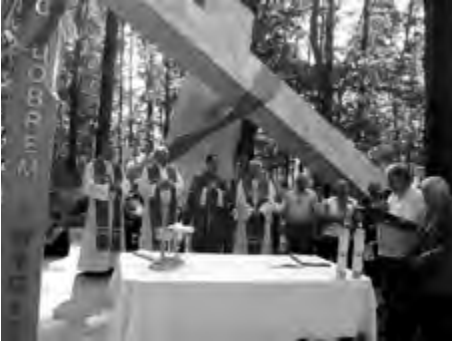
Górsk 2012 r.