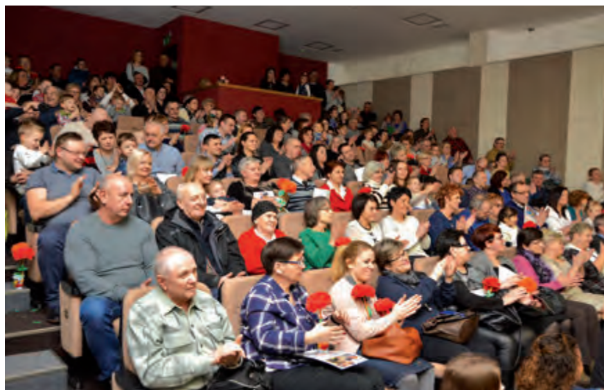
Występ dzieci z okazji Dnia Babci i Dziadka, zorganizowane przez przedszkole „Jagoda” z Górška (2017.02.10)