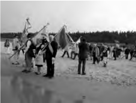
Dębki 2014 r.