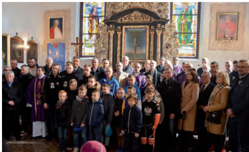
W Górsku corocznie odprawiana jest Msza św. w intencji żużlowców, kibiców i przyjaciół transmitowana przez TVP Bydgoszcz. Na zdjęciu sportowcy z rodzinami oraz miłośnicy i organizatorzy czarnego sportu (2017.03.19)