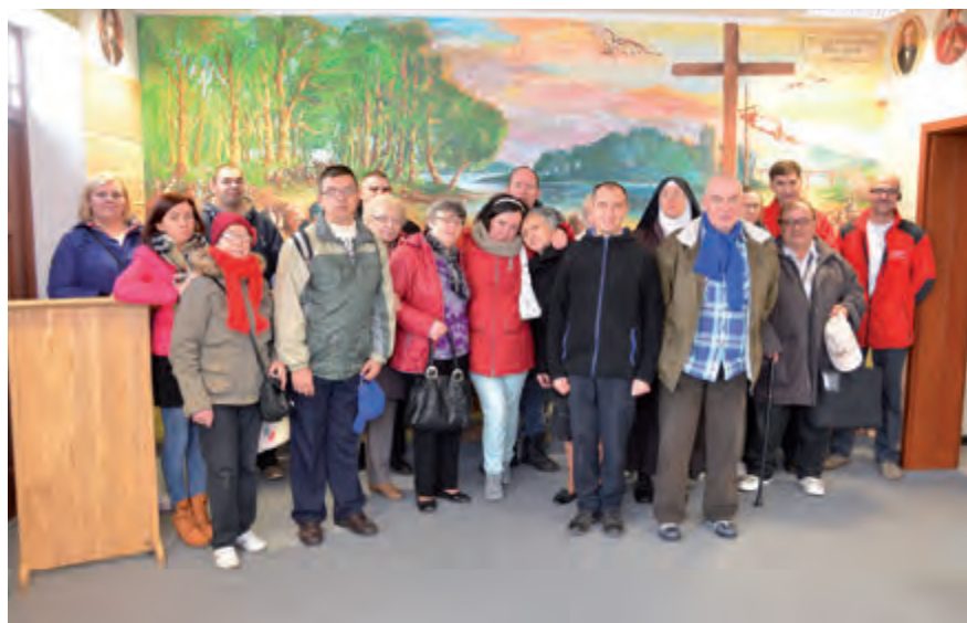
Grupa osób niepełnosprawnych z Klubu Samopomocy Centrum Pielęgnacji Caritas Diecezji Toruńskiej (2017.04.25)