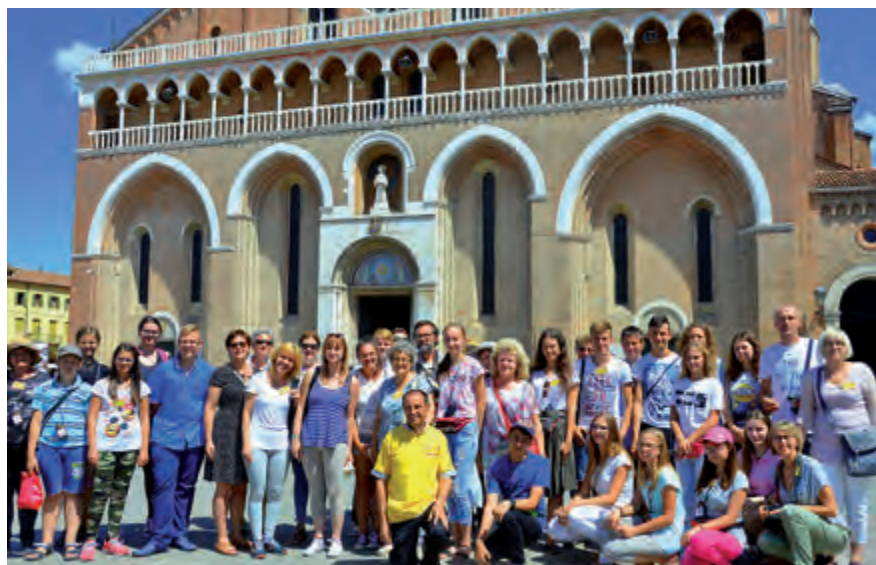
Laureaci Międzynarodowego Programu Edukacyjnego dla młodzieży „Śladami św. Jana Pawła II” w Bazylice św. Antoniego w Padwie (2017.08.04–12)