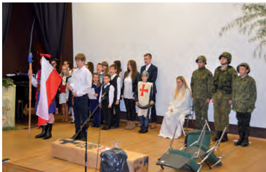
III Konfrontacje teatralne – występ z okazji Dnia Niepodległości (2017.11)