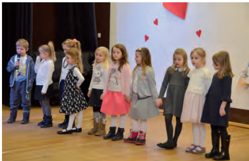
Uroczystość Dnia Babci i Dziadka zorganizowana w Centrum Edukacji Młodzieży (2017.02.10)