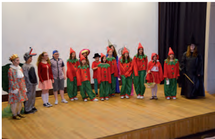
Teatr „Antrakt” wystawił przedstawienie pt. „Zamieszanie w krainie bajek” (2017.05.22)