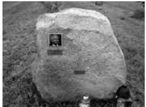
Płock Trzepowo 2012 r., Smoleński Park Pamięci