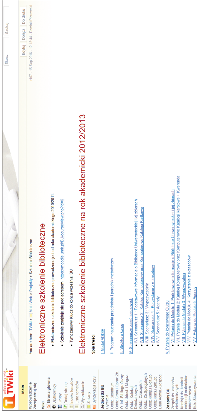
Ilustracja 1. Wiki Biblioteki Uniwersyteckiej w Toruniu