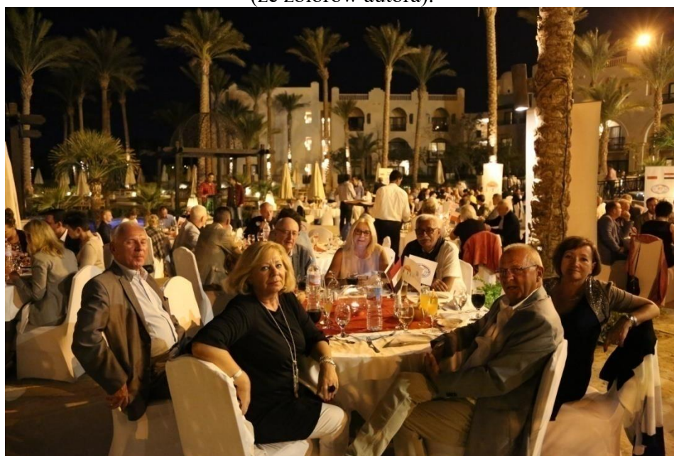
Fot. 11. Uroczysta kolacja pożegnalna.