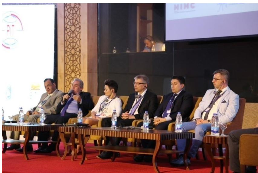
Fot. 2. It was time for questions and answers.

The most important of the proposals and provisions of the Congress of the Polish Chamber of Tourism: training with the new law, giving entrepreneurs content support and logistics for its implementation and the pursuit of a comprehensive settlement of the tourism law.