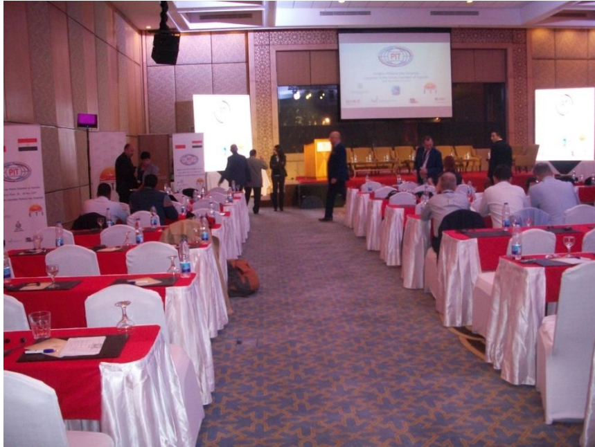
Fot. 4. Congress Hall (from the collection of the author).