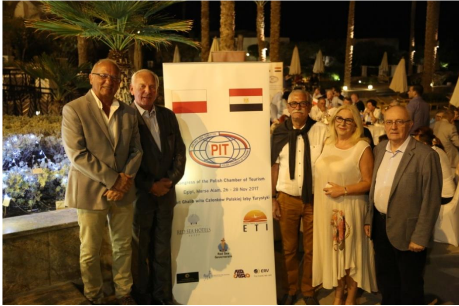
Fot. 10. Representatives of the Kujawsko-Pomorskie region branch of the PIT in Bydgoszcz (from the collection of the author).