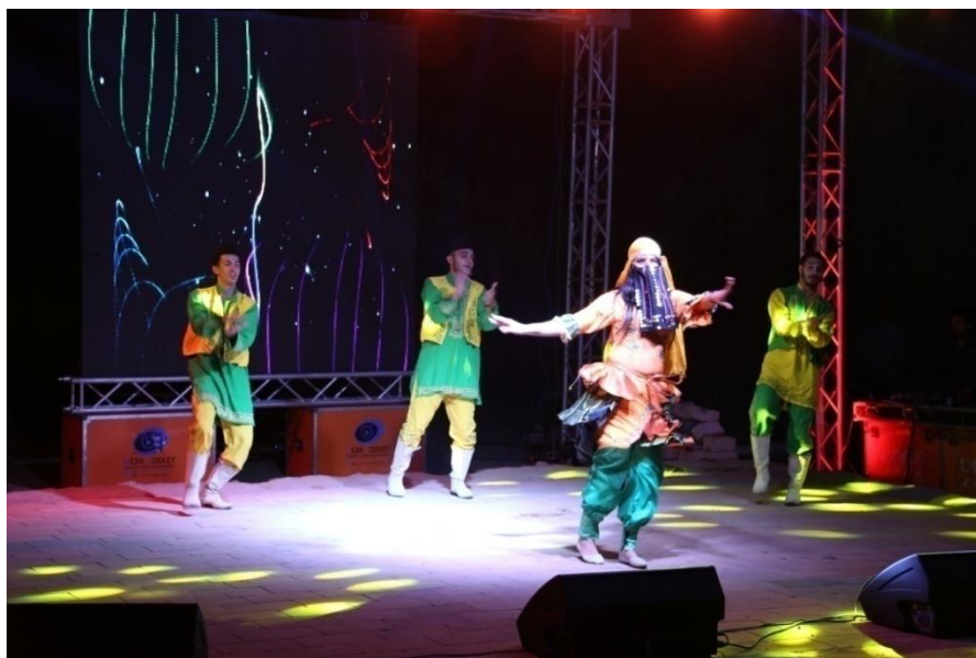
Fot. 8. Wieczór beduiński.