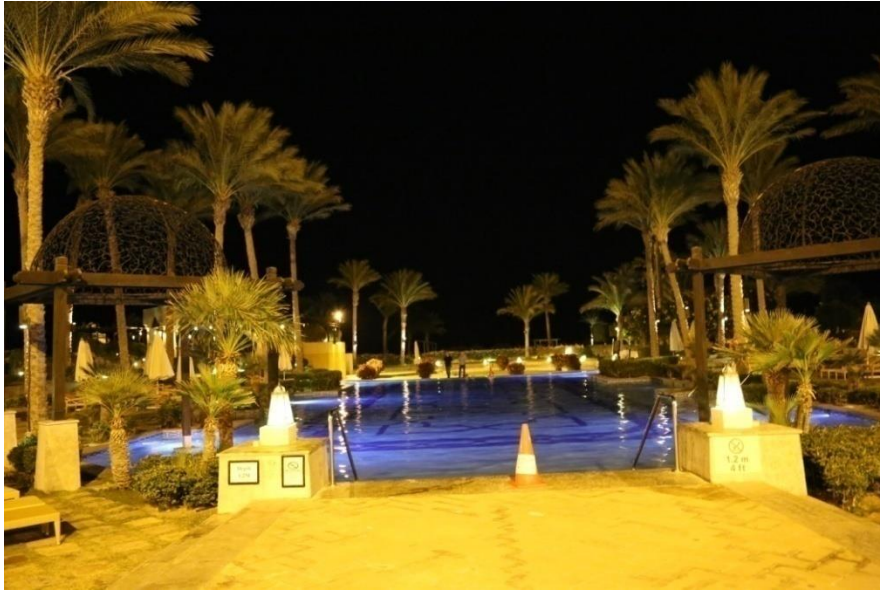
Fot. 6. Hotel at night.