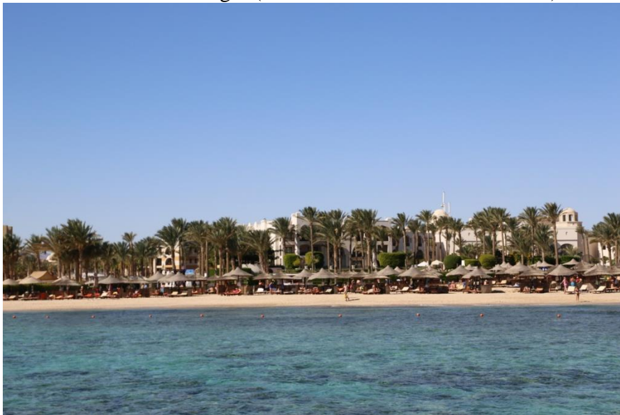
Fot. 7. Hotel Beach.