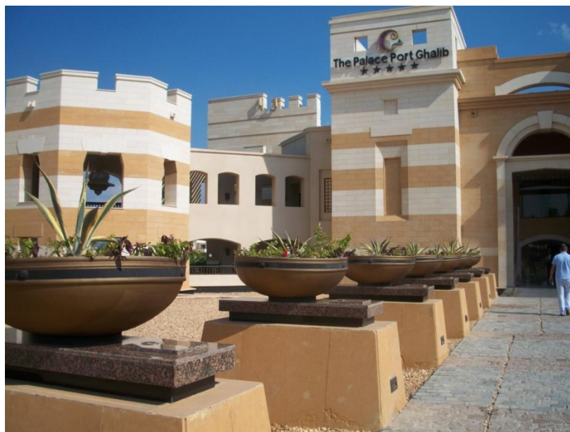
Fot. 3. Hotel The Palace Port Ghalib.