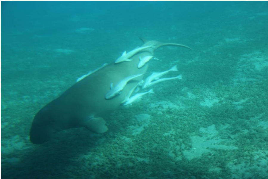
Fot. 9. Dugong.