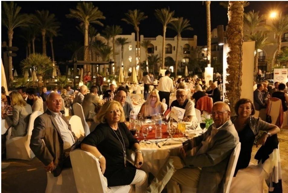
Fot. 11. The solemn farewell dinner.