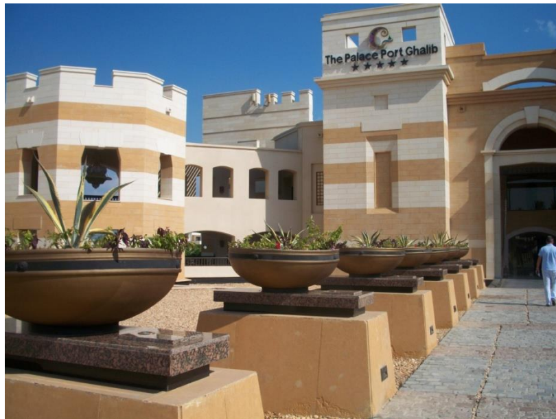
Fot. 3. The Palace Port Ghalib.