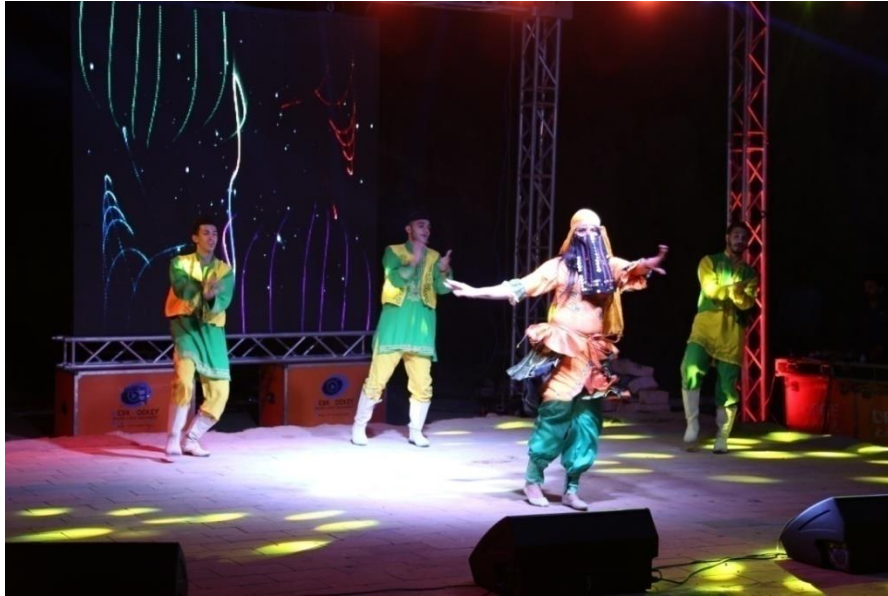
Fot. 8. Evening Bedouin