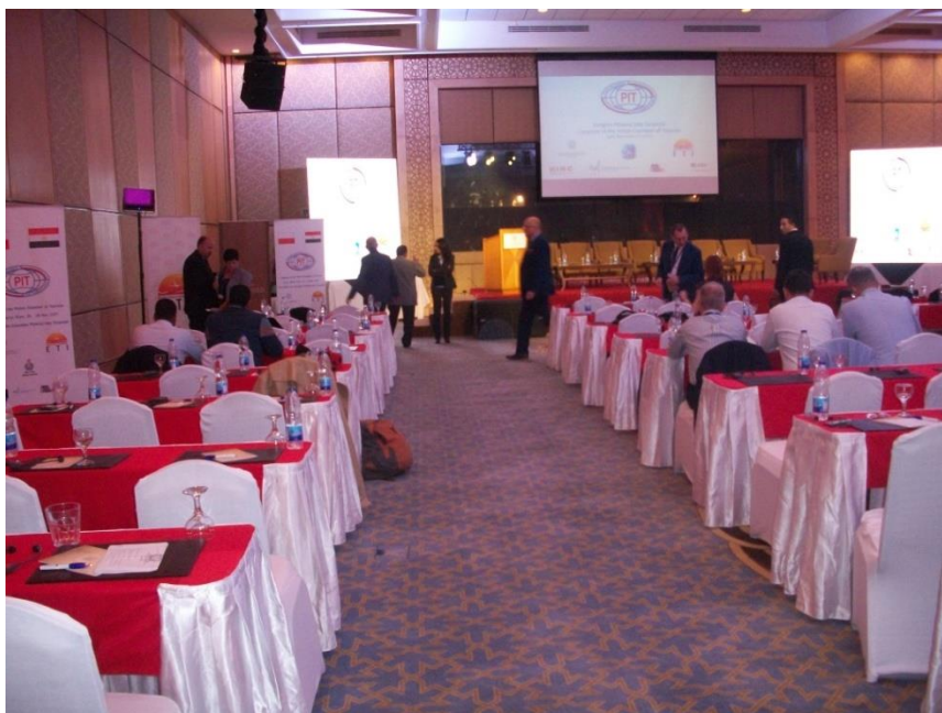
Fot. 4. Sala kongresowa.