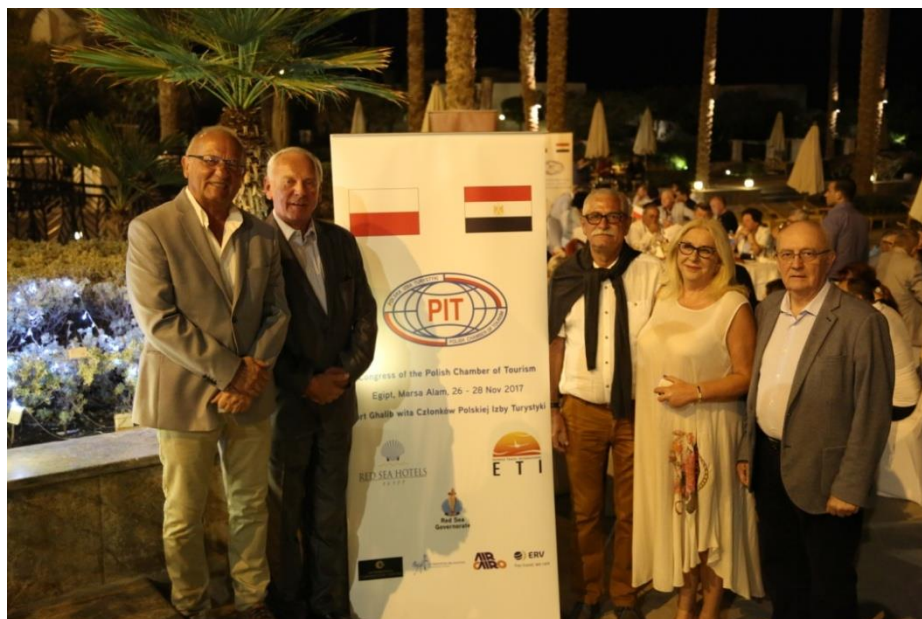
Fot. 10. Przedstawiciele Kujawsko-Pomorskiego Oddziału PIT w Bydgoszczy.