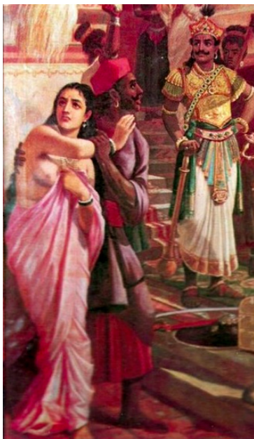
Il. 11. Ravi Varma, „Victory of Meghanada” (fragment), Shri Jayachamarajendra Art Gallery, Majsur (obraz w domenie publicznej)