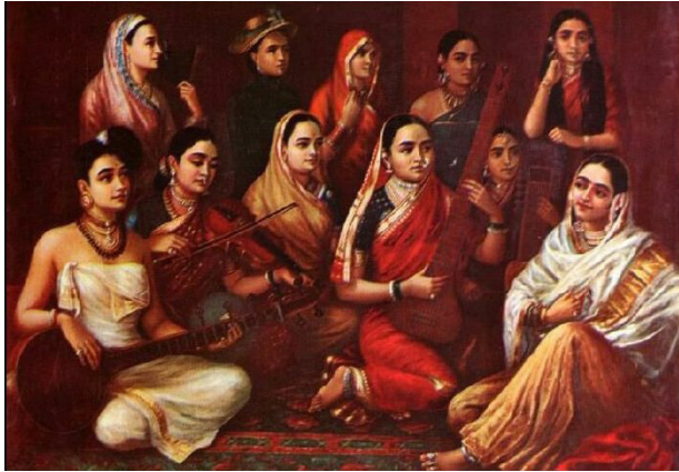
Il. 2. Ravi Varma, Galaxy of Musicians , 1889, Shri Jayachamarajendra Art Gallery, Majsur (obraz w domenie publicznej)