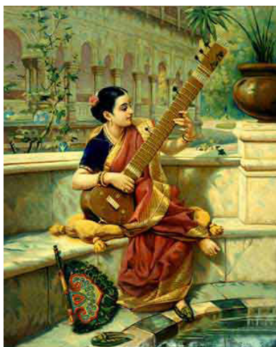
Il. 4. Ravi Varma, Lady playing Sitar, data nieznana, zbiory prywatne (obraz w domenie publicznej)