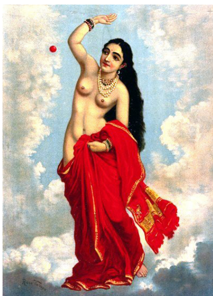
Il. 9. Ravi Varma, Tilottama, 1896, (oleodruk w domenie publicznej)