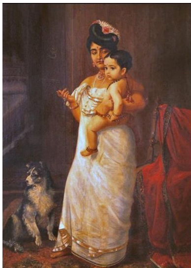
Il. 5. Ravi Varma, There Comes Papa, 1893, Kowdiar Palace, Trivandrum (obraz w domenie publicznej)