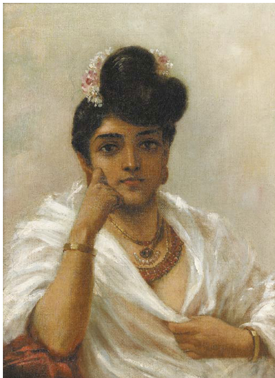
Il. 1. Ravi Varma, „Malabar Beauty”, zbiory prywatne (obraz w domenie publicznej)