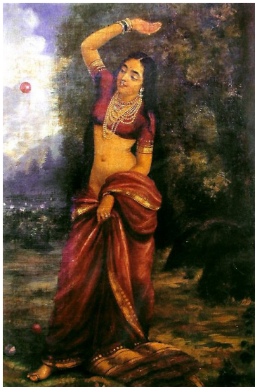
Il. 10. Ravi Varma, „Lady at Ball Game”, zbiory prywatne