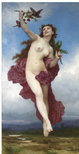
Il. 8. William Adolphe Bouguereau, Le jour, 1884, zbiory prywatne