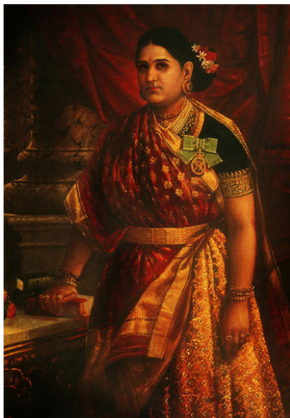
Il. 6. Ravi Varma, „Rani Lakshmi Bayi z Travancore”, Sri Chithira Art Gallery, Thiruvananthapuram, (obraz w domenie publicznej)