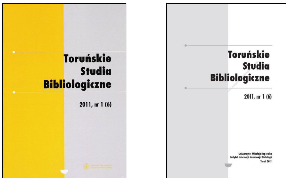
Rys. 2. Okładka i karta tytułowa nr 1(6) TSB z roku 2011.

w punkcie styku dwóch prostokątów ulokowano biały półokrąg. Na grzbiecie, z góry na dół, białym kolorem biegnie tytuł czasopisma oraz paginacja numeru rozdzielona odwróconym półokręgiem. U dołu grzbietu znajduje się logo Wydawnictwa Naukowego UMK. Dolna okładka pozostaje jednolita w kolorze właściwym dla danego roku i zawiera jedynie numer ISSN 2080-1807 periodyku. Wyjątkowo na okładce numerów z 2010 r., w związku z jubileuszem 65-lecia UMK, zamieszczono okolicznościowy logotyp.