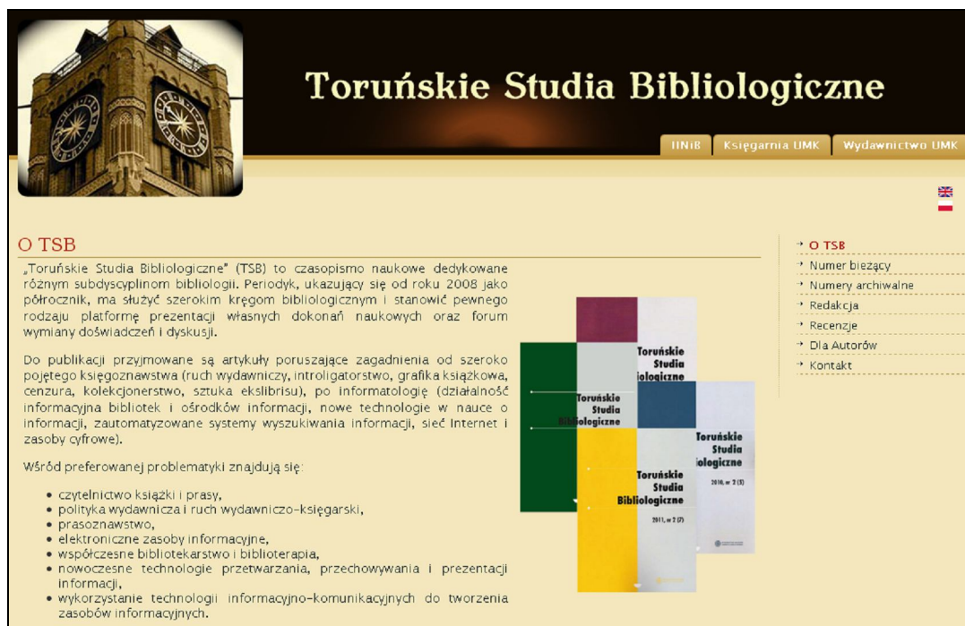
Rys. 4. Strona główna „Toruńskich Studiów Bibliologicznych”.