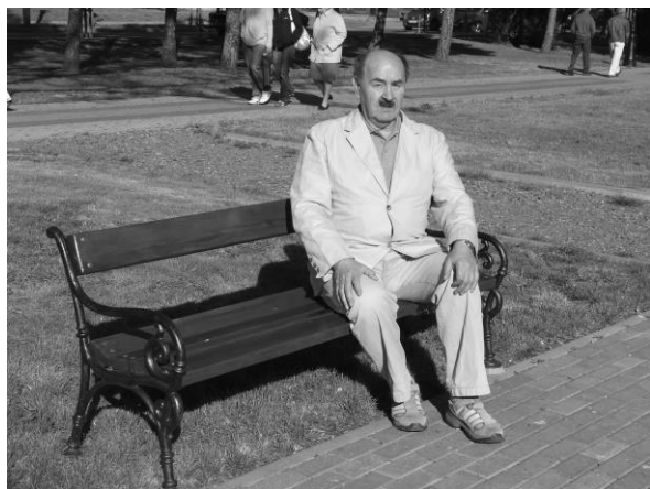
Fot. 3. Wiosenny wypoczynek w ulubionym Ciecho-cinku (przełom kwietnia i maja 2007 r.)

A Autorzy jednego z referatów wygłoszonych w trakcie tejże konferencji, zastanawiając się nad fenomenem instytucjonalizacji pedagogiki społecznej w Polsce, jednoznacznie stwierdzili: „W naszej ocenie, Profesor Stanisław Kawula jest od dawna już twórcą szkoły naukowej w obszarze edukacji międzykulturowej...” [Radziewicz-Winnicki, Walancik 2010, s. 29].