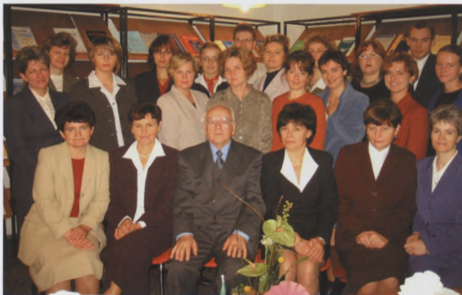
Pracownicy Biblioteki, wrzesień 2002 r.

Początkowo działalność ograniczała się tylko do organizowania pomieszczeń, gromadzenia i opracowywania zbiorów. Prace adaptacyjne trwały do marca 1976 r. W nowo otwartej Bibliotece czytelnikom udostępniono 70 miejsc w czytelniach i sali katalogowej. W czytelniach znajdował się tylko księgozbiór medyczny oraz informatory i od początku wprowadzono w nich wolny dostęp do półek.