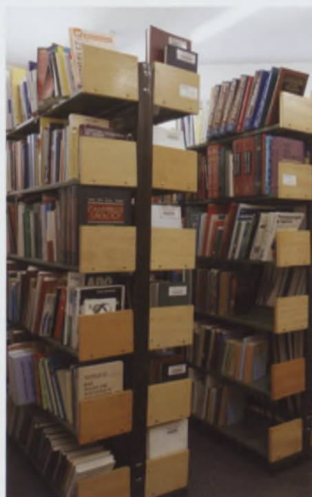
Magazyn druków zwartych

Obecnie Biblioteka posiada blisko 70 000 woluminów książek i ponad 13 500 wol. czasopism (ok. 2500 tytułów) z zakresu medycyny i nauk pokrewnych. Uzupełnieniem księgozbioru medycznego są wydawnictwa o charakterze encyklopedycznym, informatory z wielu dziedzin wiedzy oraz słowniki biograficzne i językowe.