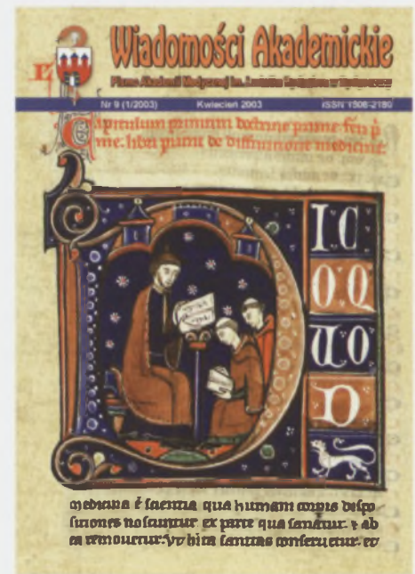
Faksimile okładki 9 numeru „Wiadomości Akademickich” z kwietnia 2003 r.

Biuro Informacji Międzynarodowej dla Studentów