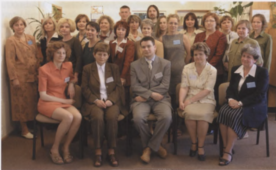
Pracownicy Biblioteki, maj 2004 r.

Przyrost księgozbioru był dynamiczny, tak iż już w 1978 r. liczył blisko 30 tys. woluminów oraz niemal 300 tytułów czasopism polskich i zagranicznych.