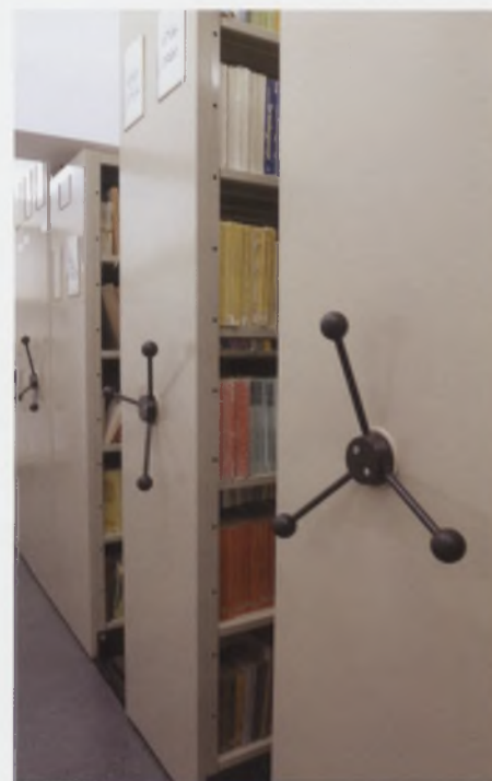
Magazyn druków zwartych z regalami kompaktowymi