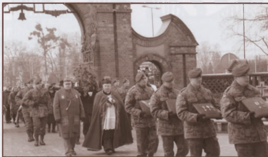
Msza żalobna w Katedrze Bydgoskiej i kondukt żalobny na Cmentarzu Nowofarnym, grudzień 2009