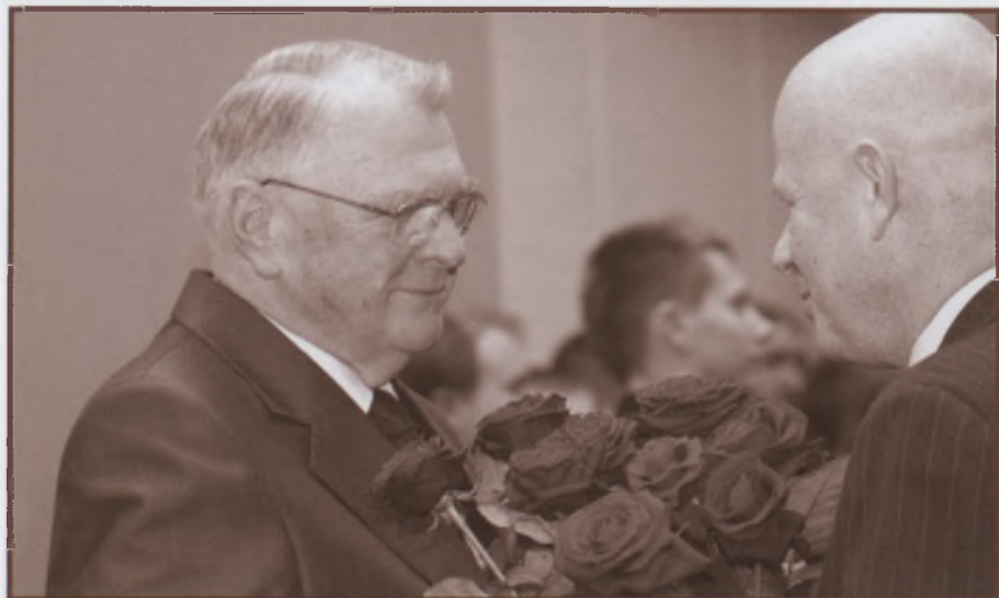
Jubileusz 50-lecia pracy zawodowej w Bydgoszczy, listopad 2009

gii. We wspomnianym już wywiadzie, jaki opublikowano w końcu 2009 roku tak odniósł się do tego zagadnienia: Rzeczywiście przez te kilkadziesiąt lat starałem się stworzyć bydgoską szkołę patomorfologii klinicznej wyraźnie ukierunkowaną na histoklinikę i immunologię chorób serca i naczyń oraz na histoklinikę i immunologię nowotworów. Dążyłem do skupienia wokół siebie nie tylko licznych uczniów patomorfologów i innych osób niebędących lekarzami, ale również klinicystów zainteresowanych tymi najgroźniejszymi chorobami cywilizacji. Moim współpracownikiem starałem się wpajać umiejętności prowadzenia badań zespołowych, co pozwala na kompleksowe opracowanie analizowanych problemów. Pragnąłem wykształcić typ nowoczesnego patologa przerzucającego pomost pomiędzy patomorfologią a kliniką”