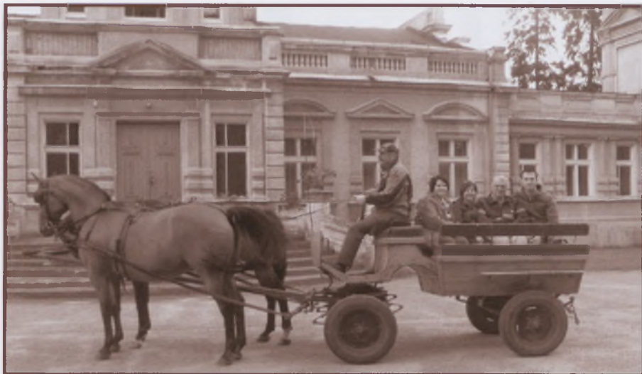
Mieczownica, z żoną i dziećmi, 2009