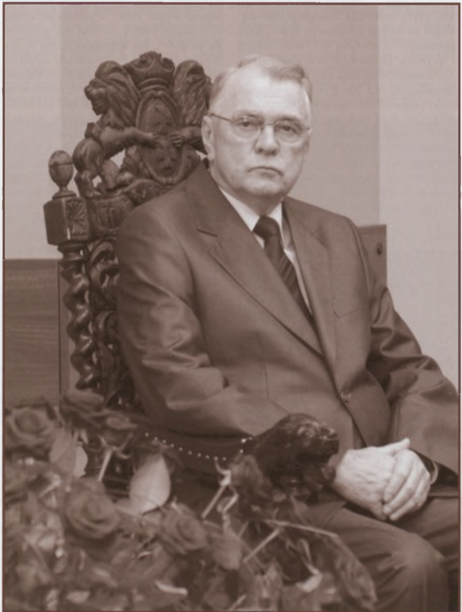
Jubileusz 50-lecia pracy zawodowej w Bydgoszczy, listopad 2009