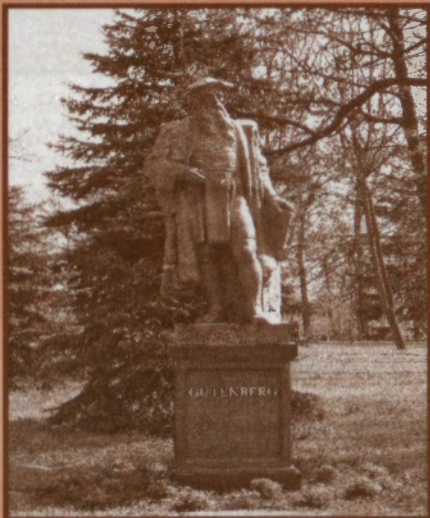
Pomnik Jana Gutenberga, aut. S. Radwański 1996, Pelplin ogród biskupi.