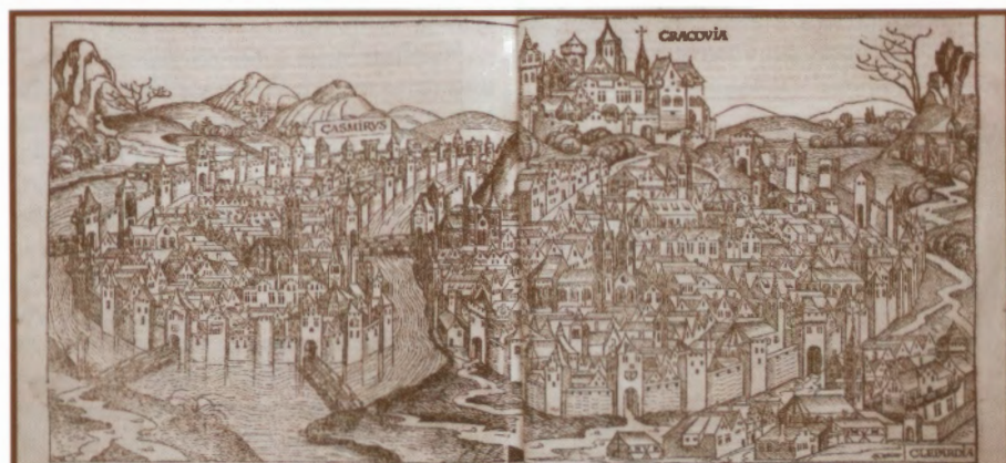
Hartmann Schedel, Liber chronicarum, Norymberga 1493, karta z wizerunkiem Krakowa i Kazimierza