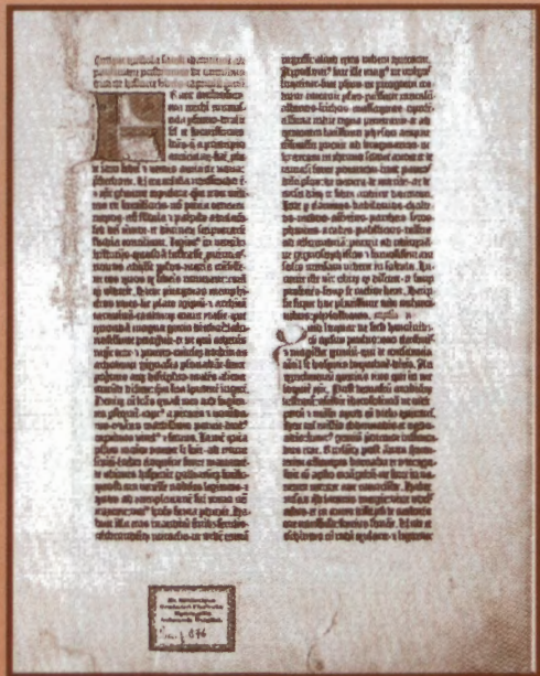
Biblia Gutenberga, Moguncja 1454/1455; pierwsza karta z początkiem złoconym F, kopia z faksymile, Pelplin 2002 Wydaw. Bernardinum