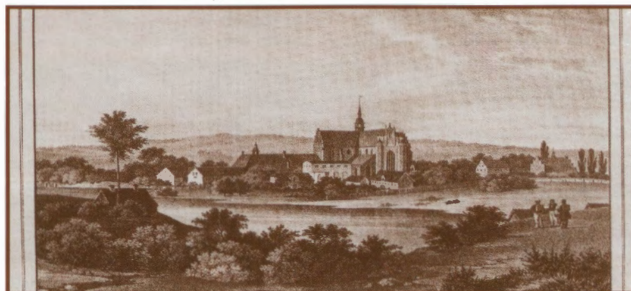
Widok Pelplina, litografia 1836