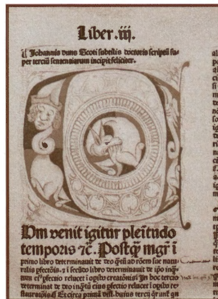
Ioannes Dunst Scotus, Quaestiones in IV libros Sententiarum , Norymberga 1481; inicjał wstępny, Pelplin, BWS D Inc. F. 826 adl.

Janusz Tondel, Inkunabuły w zbiorach Biblioteki Wyższego Seminarium Duchownego w Pelplinie , Pelplin-Toruń 2008