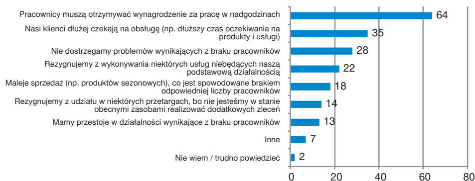
Wykres 2. Odpowiedzi respondentów na pytanie: Jakie problemy związane z brakiem pracowników dostrzegają Państwo w swojej organizacji? (w%)

Trudności z pozyskaniem odpowiednich pracowników często dotyczą małych przedsiębiorstw, które nie są w stanie zaoferować potencjalnym pracownikom atrakcyjnych wynagrodzeń 6 .