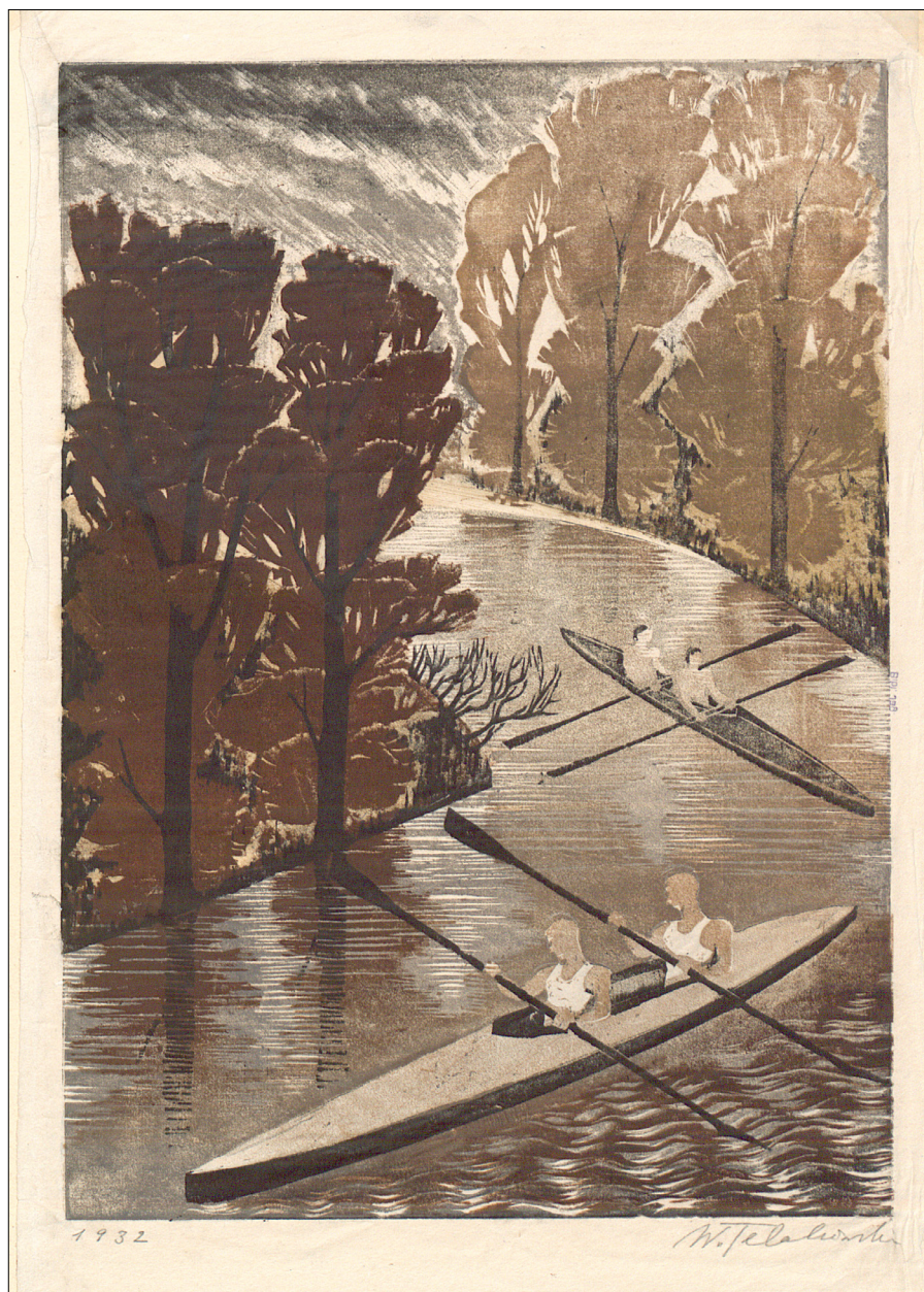
Il. 4. Wanda Telakowska, Sport i przyroda , 1932, drzeworyt, zb. Biblioteki Jagiellońskiej [nazwisko fotografa: do ustalenia]