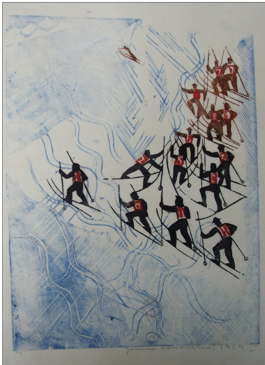
Il. 1. Janina Konarska, Narciarze , 1929, drzeworyt barwny, zb. prywatne, fot. K. Kulpińska