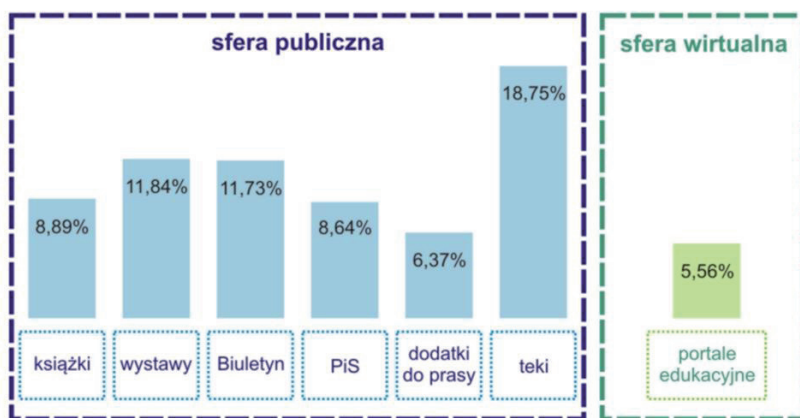
Rys. 2. Udział procentowy narracji o zbrodniach stalinowskich w ogóle narracji Instytutu Pamięci Narodowej w latach 2000–2010 z podziałem na poszczególne narzędzia [oprac. Patrik Wawrzyński, na podstawie przeprowadzonej analizy ilościowej]