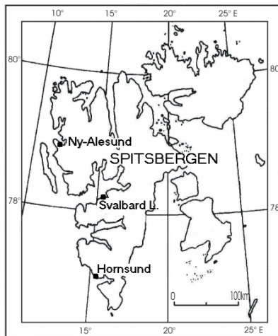
Ryc. 1. Położenie stacji meteorologicznych wykorzystanych w opracowaniu

W ciągu całego roku w Ny Ålesund dominują wiatry SE i E. Ich udział jest szczególnie duży w zimie i jesieni – odpowiednio 30 i 15% oraz 31 i 13% (Hanssen-Bauer i in. 1990). W lecie natomiast, oprócz wyżej wymienionych kierunków wiatru (częstość 17% w obydwu przypadkach), częste są także wiatry z kierunku NW (14%). Te przeważające kierunki wiatru są zgodne z przebiegiem Kongsfiorden i dolin, które wypełniają lodowce Kongsvegen i Kronebreen. Najsilniejsze wiatry występujące jesienią, a szczególnie zimą, są wynikiem intensywnej w tych porach roku cyrkulacji cyklonalnej. Najbardziej wietrznym miesiącem jest styczeń (5.1 m/s), w tym szczególnie jego pierwsze dwie dekady (ryc. 2), a najbardziej spokojnym – czerwiec i lipiec (po 2.7 m/s). W okresie 1981–2000 średnia roczna prędkość wiatru wyniosła 3.8 m/s (tab. 1). We wrześniu notowany jest największy wzrost prędkości wiatru, a w marcu – spadek (ryc. 2).