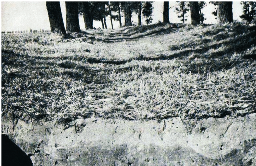
Ryc. 1. Reclaw, woj. zachodniopomorskie. Profil eksplorowanej drogi z widocznymi śladami kolein wczesnośredniowiecznych (wg Kiersnowscy 1970)