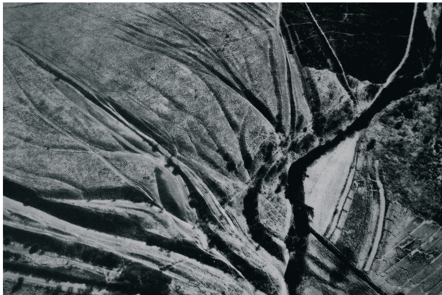
Ryc. 3. Twyford Downs, Hampshire, Wielka Brytania. Fotografia lotnicza wiązki dróg używanych od czasów rzymskich do współczesnych (wg Hindle 1989)