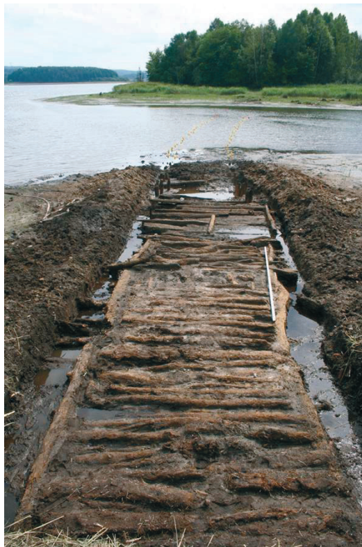
Ryc. 2. Żydowo, woj. zachodniopomorskie, stanowisko 42. Fragment drewnianej drogi wczesnośredniowiecznej odkrytej na północ od przyczółka mostowego