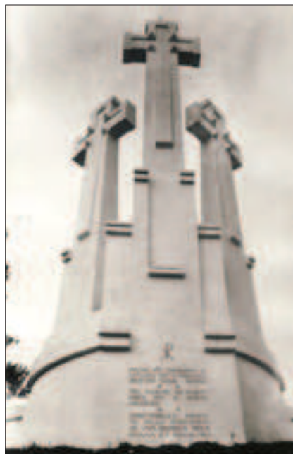
Il. 5. Antoni Wiwulski, Trzy Krzyże w Wilnie 1916