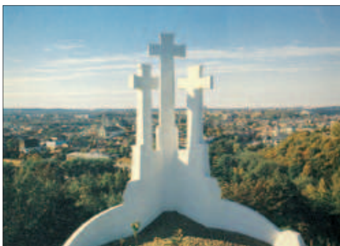
Il. 8. Odbudowane Krzyże na tle panoramy Wilna