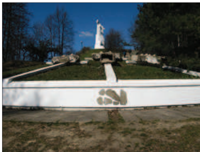
Il. 10. Trzy Krzyże odbudowane i zniszczone