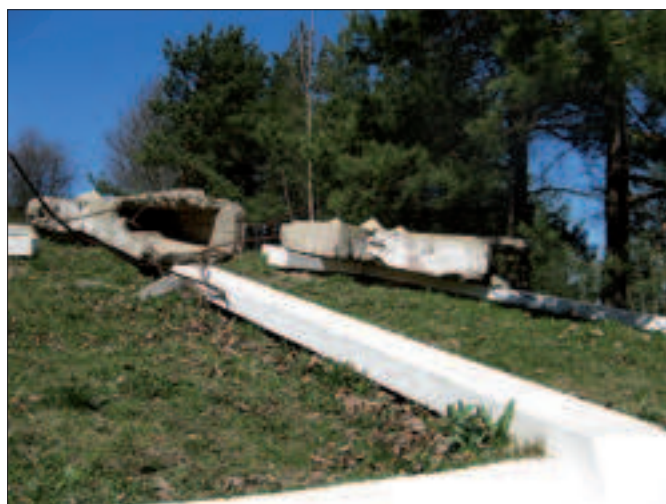
Il. 6. Zniszczone Krzyże Wiwulskiego, fot. A. Mosingiewicz