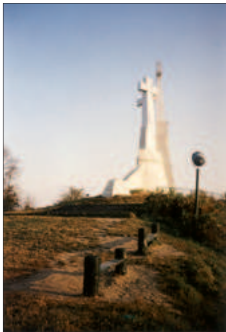
Il. 9. Odbudowane Trzy Krzyże, widok z boku