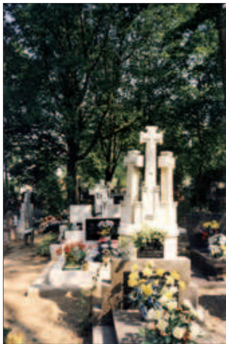
Il. 1. Nagrobek Michaliny Najworsz (1900–1983) na cmentarzu komunalnym w Giżycku