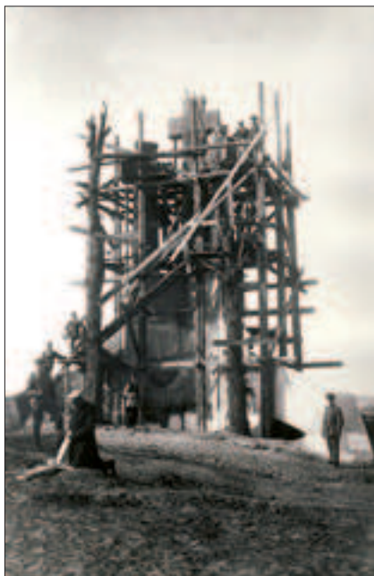
Il. 4. Budowa Trzech Krzyży, Wilno 1916