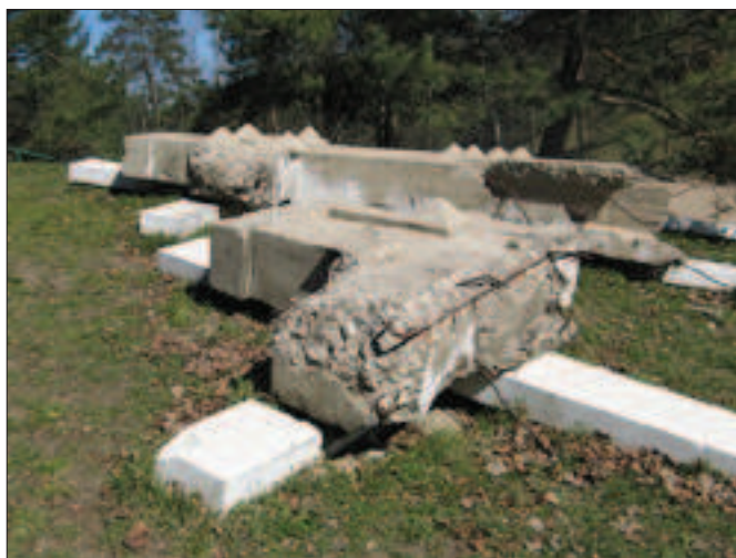
Il. 7. Zniszczone Krzyże Wiwulskiego