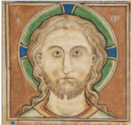
Il. 6. Miniatura w Chronica Maiora po 1245 r., Cambridge, Corpus Christi College, dostęp w Internecie; http://commons.wikimedia.org/wiki/Category:Historia_Major_of_Matthew_Paris (3.02.2013)