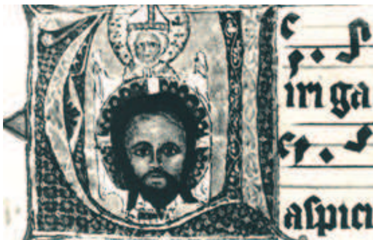
Il. 9a. Miniatura, Veraicon trzymany przez biskupa, lata 70. XIV wieku, Graduał Pelpliński, Pelplin, Biblioteka Seminarium, fot. za Karłowska-Kamzowa 1990, il. 108