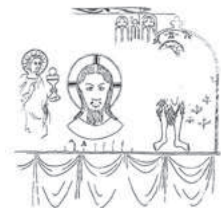
Il. 1. Malowidła ścienne, ok. 1350–1360 r., Toruń, ul. Żeglarska 17/19, fot. za Doma- słowski 1984, rys. 32