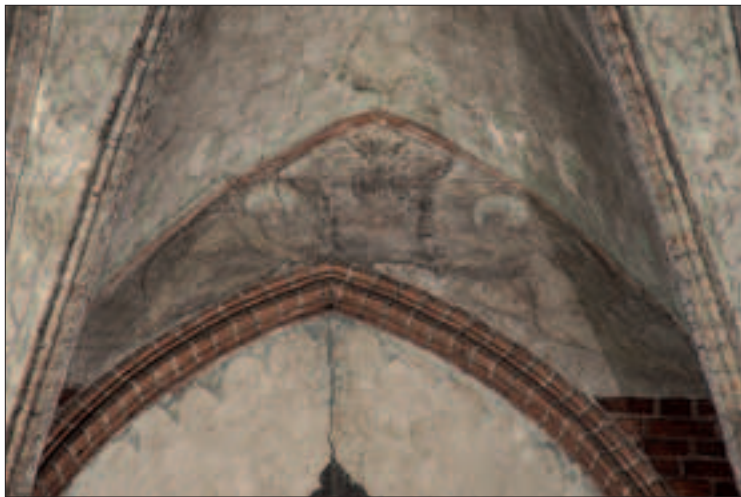
Il. 2. Malowidła ściennie, Veraicon trzymany przez dwa anioły, ok. 1390 r., Toruń, kościół św. Jakuba