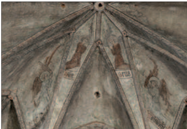
Il. 3. Malowidła ściennie (ściana wschodnia, sklepienie) ok. 1390 r., Toruń, kościół św. Jakuba