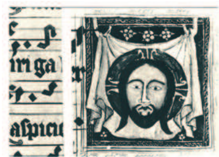
Il. 9b. Miniatura, Veraicon, lata 70. XIV wieku, Graduał Pelpliński, Pelplin, Biblioteka Seminarium