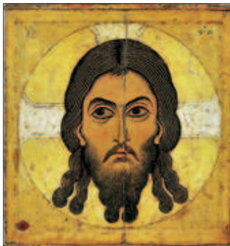
Il. 4. Ikona, Mandylion z Nowgorodu, k. XII w., Moskwa, Galeria Tretiakowska, dostęp w Internecie: http://www.icon-art.info/masterpiece.php?lng=de&mst_id=141 (3.02.2013)