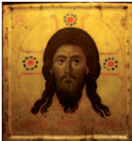
Il. 7. Ikona, Święte Oblicze z Laon, XIII w., Laon, katedra, dostęp w Internecie; http://sosreb.wordpress.com/2012/09/ (3.02.2013)