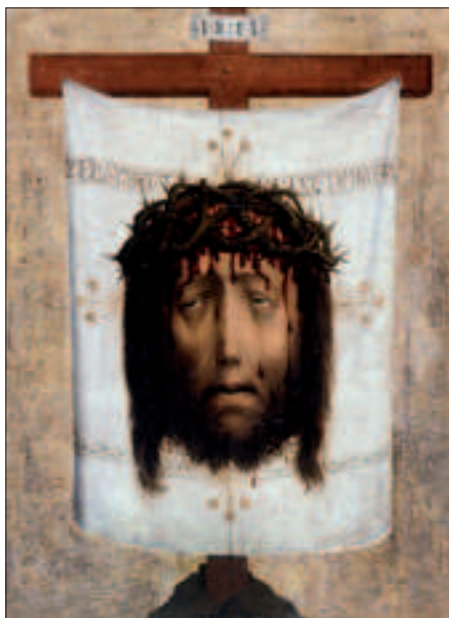
Il. 5. Obraz na desce, Veraicon z Legnicy, ok. 1450 r., Wrocław, Muzeum Narodowe, fot. za Ziomecka 2003, il. 47