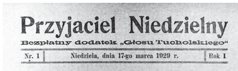
Ilustracja 7. Winieta pierwszego numeru „Przyjaciela Niedzielnego” z 17 marca 1929 r.

dawano jedynie datę ukazania się. Charakteryzował się dużą liczbą zdjęć i ilustracji przy małej ilości tekstu. Publikowano w nim m.in. zdjęcia aktorów kinowych i teatralnych („Ze srebrnego ekranu”), zdjęcia z egzotycznych krajów i z dziedziny mody.