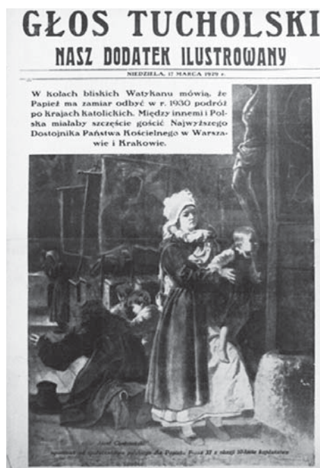
Ilustracja 8. Okładka „Naszego Dodatku Ilustrowanego”