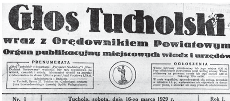
Ilustracja 6. Winieta pierwszego numeru „Głosu Tucholskiego” z 16 marca 1929 r. (fot. autorka)

Źródło: „Głos Tucholski” 1929, nr 1, s. 1 WBP Książnica Kopernikańska, sygn. 01225.