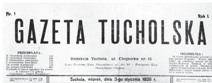
Ilustracja 4. Winieta pierwszego numeru „Gazety Tucholskiej”

Winieta periodyku tworzył napis „Gazeta Tucholska” 13 ; nad nim, w górnym lewym rogu, znajdował się kolejny numer pisma, w rogu prawym – rok ukazania się. Pod winietą, z lewej strony, umieszczono ceny przedpłaty i informację, że periodyk wychodzi trzy razy w tygodniu: we wtorek, czwartek i sobotę. W środkowej części, pod winietą, widniał adres redakcji oraz numer konta pocztowego. Po prawej stronie podawano ceny ogłoszeń. Poniżej, oddzielone grubą kreską, znajdowały się następujące informacje: wschód i zachód słońca na dzień bieżący i następny, miejsce wydania – Tuchola, dzień tygodnia i pełna data oraz wschód i zachód księżyca na dzień bieżący i następny.