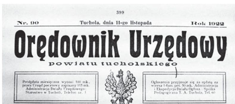
Ilustracja 2. Winieta „Orędownika Urzędowego Powiatu Tucholskiego”

strony, pod winieta, także w ramce, zamieszczono cennik ogłoszeń oraz informację, że za administrację i ekspedycję działu ogłoszeń jest odpowiedzialna Spółka Pedagogiczna Towarzystwo Akcyjne w Tucholi. Poniżej winiety drukowano spis treści. Liczbowanie stron było ciągłe w całym roku.