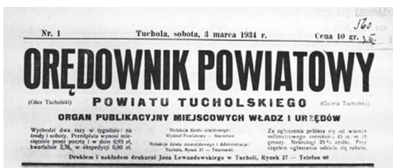
Ilustracja 3. Winieta „Orędownika Powiatowego Powiatu Tucholskiego”