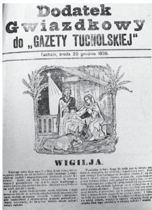
Ilustracja 5. Okładka „Dodatku Gwiazdkowego do Gazety Tucholskiej” z 25 grudnia 1929 r.

Znajdował się w nim m.in. tekst o Wigilii, wiersz W noc wigilijną , opowiadanie Przyjaciele oraz kącik „Humor i Satyra”.