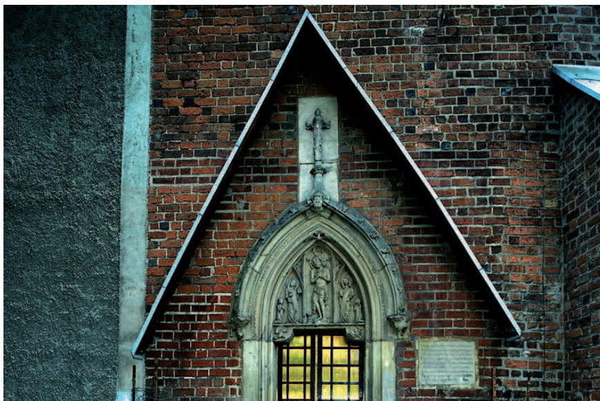
Il. 1. Tympanon portalu kaplicy zamkowej w Lubinie – Eucharystyczny Chrystus Bolesny