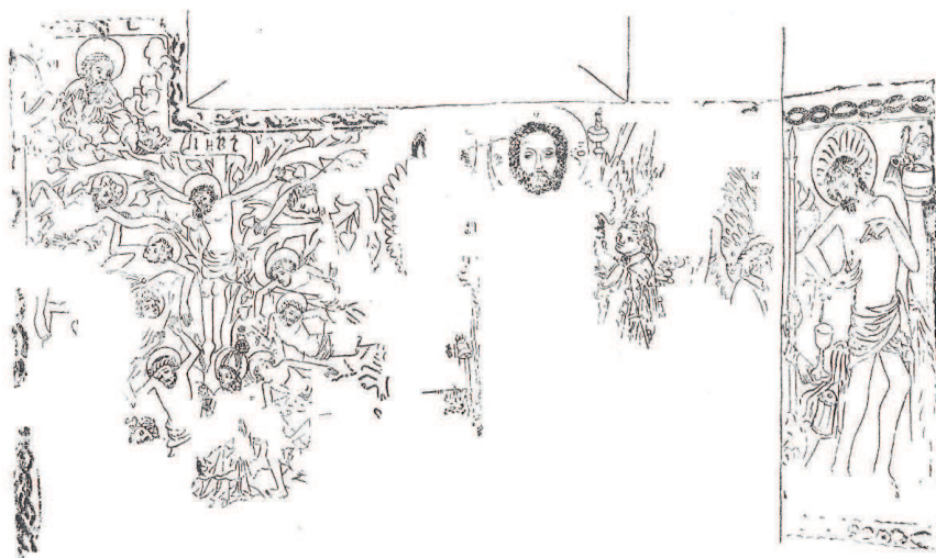
Il. 4. Malowidła ściennie, prezbiterium kościoła Najświętszej Marii Panny w Krzyżowicach – różne tematy eucharystyczne, za: A. Karłowska-Kamzowa, Malarstwo śląskie 1250–1450 , Wrocław 1979