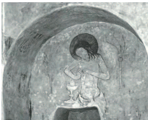
Il. 2. Malowidło ściennie, nisza sakrarium, kościół parafialny św. św. Kosmy i Damiana w Okoninie – Eucharystyczny Chrystus w Studni, za: Malarstwo gotyckie w Polsce , katalog, album ilustracji pod red. A. S. Labudy, K. Secomskiej, Warszawa 2004