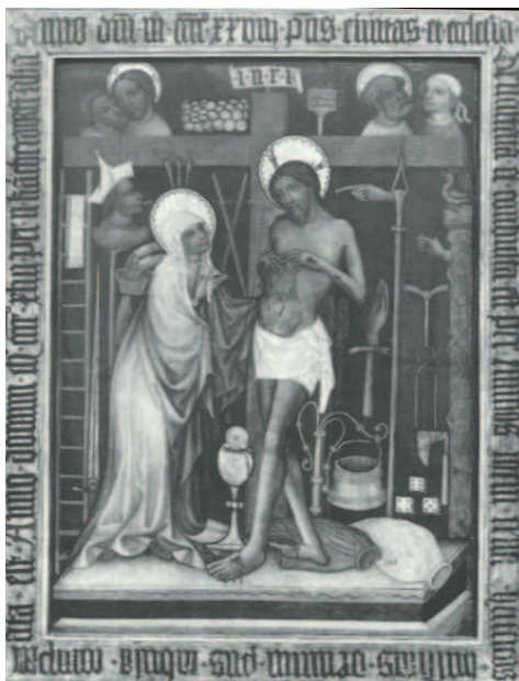
Il. 7. Obraz tablicowy z kościoła św. Mikołaja w Brzegu – Eucharystyczny Chrystus Bolesny, za: Malarstwo gotyckie w Polsce