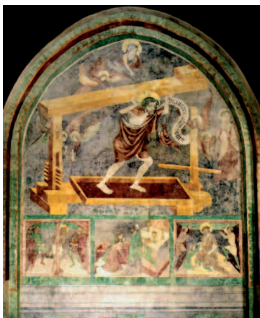
Il. 6. Malowidło ściienne w kruzgankach franciszkańskich w Krakowie – Chrystus w Tłoczni Misticznej, za: http://artyzm.com/obraz.php?id=2150