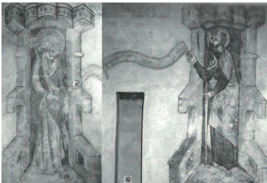
Il. 3. Malowidła ściennie, ściana wschodnia kościoła parafialnego św. św. Kosmy i Damiana w Okoninie – św. Piotr, św. Paweł, za: Malarstwo gotyckie w Polsce