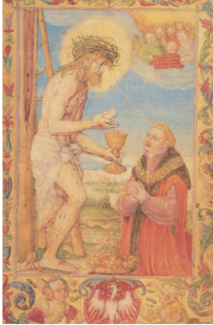
Il. 9. Miniatura w modlitewniku króla Zygmunta I – Eucharystyczny Chrystus Bolesny, za: Wawel 1000–2000. Wystawa jubileuszowa , katalog, t. 1–3, Kraków 2000