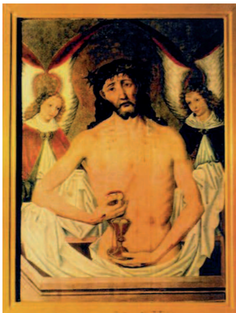
Il. 8. Tablica środkowa tryptyku z kościoła św. Marcina w Donaborowie – Eucharystyczny Chrystus w Studni