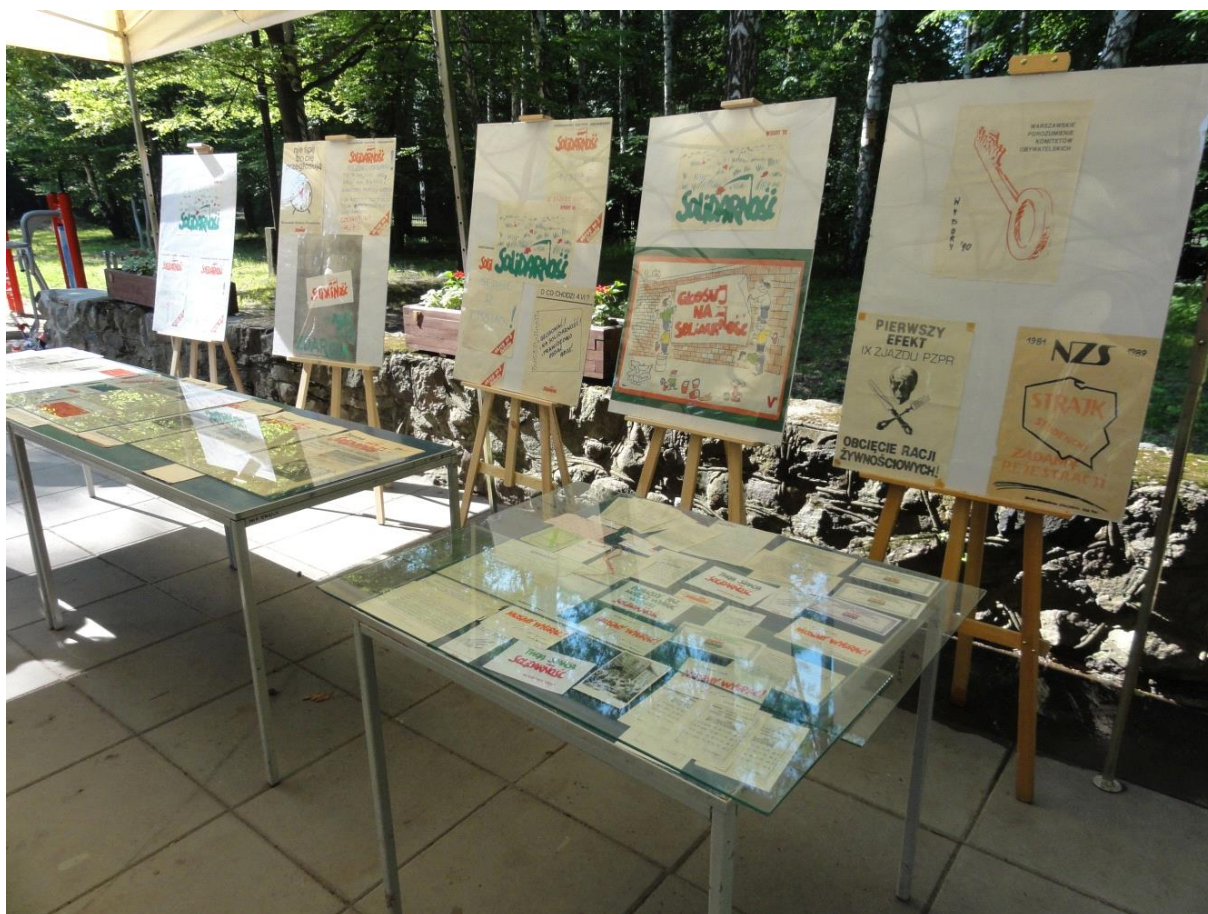
Ogród archiwalny Obywatelskiego Archiwum Podkowy Leśnej w trakcie Festiwalu Otwarte Ogrody, 13.06.2015