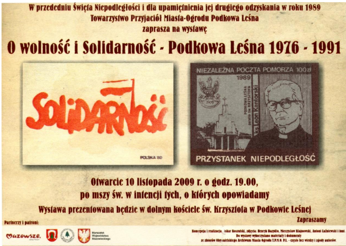
Plakat wystawy „O wolność i Solidarność – Podkowa Leśna 1976-1991”, 2009, http://www.podkwoalesna-tppl.pl/kronika/2009/zaproszenie-2009.jpg [dostęp: 10.02.2018]