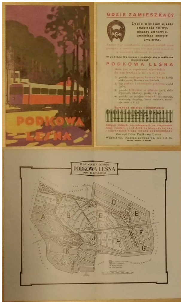
Folder zachęcający do zamieszkania w Podkowie Leśnej, ok. 1926; Obywatelskie Archiwum Podkowie Leśnej, Archiwum działalności Towarzystwa Przyjaciół Miasta-Ogrodu Podkowa Leśna do 1939 r., sygn. 24.