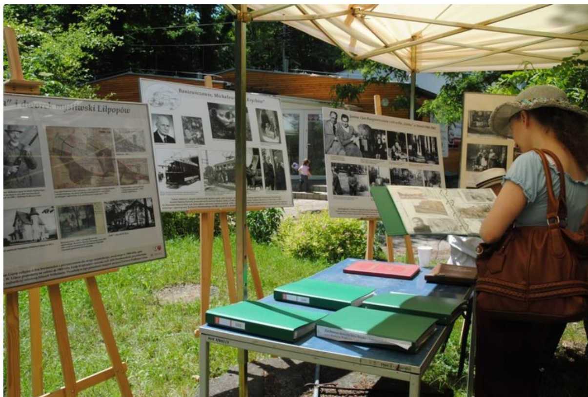
Ogród archiwalny Obywatelskiego Archiwum Podkowy Leśnej w trakcie Festiwalu Otwarte Ogrody, 6-8.06.2014, http://www.ckiopodkowa.pl/festiwal-otwarte-ogrody-2014 [dostęp 10.02.2018].