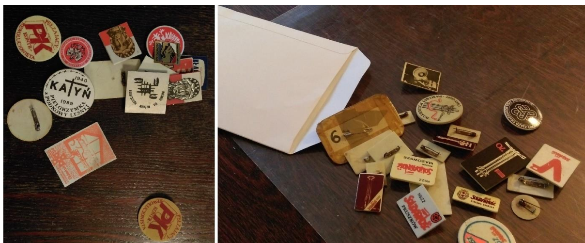
Znaczki przypinane z lat 80.; Obywatelskie Archiwum Podkowy Leśnej, zbiór Podkowa niezależna, sygn. 61.