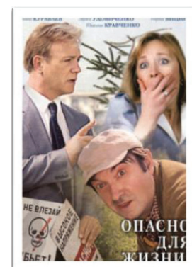
Uwaga! Wysokie napięcie! ( Опасно для жизни ), 1985, reż. Leonid Gajdaj, pokaz: 13.05.2016