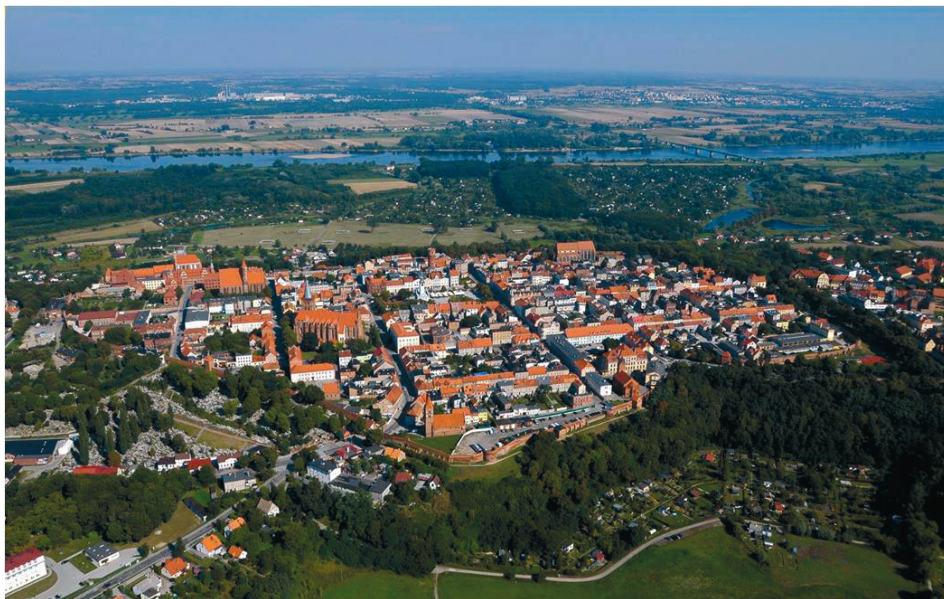
Ryc. 5. Widok na współczesne Chełmno z zachowanym średniowiecznym układem urbanistycznym