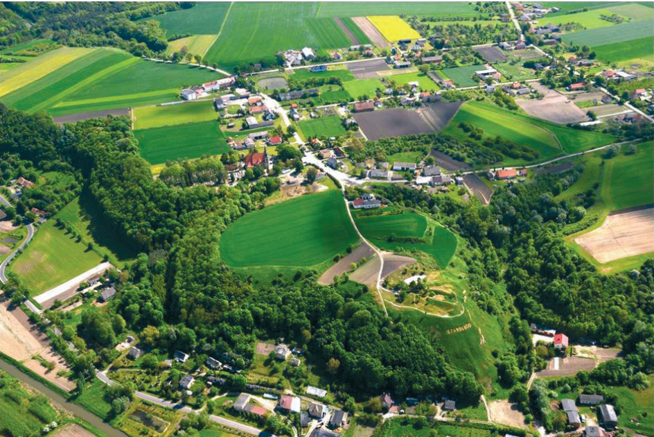
Ryc. 4. Widok na grodzisko i zamczysko w Starogrodzie Fig. 4. View of the stronghold and the castle in Starogród