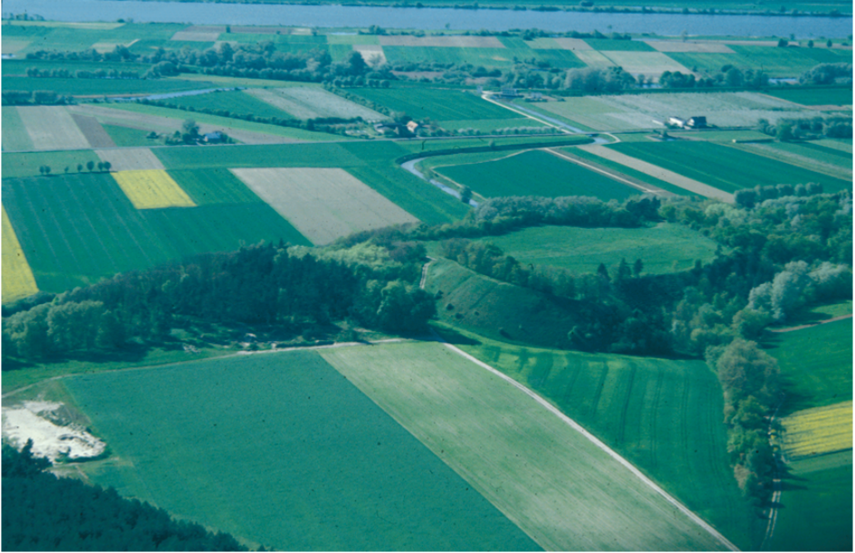
Ryc. 3. Widok na Górę św. Wawrzyńca w Kaldusie Fig. 3. View of Mount St. Laurence in Kaldus