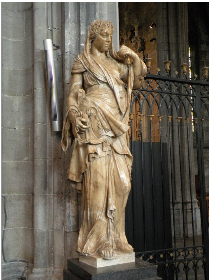
Il. 3. Jacques Du Broeucq z warsztatem, Temperantia , 1540–1548, figura z lektorium kolegiaty St. Waudru w Mons