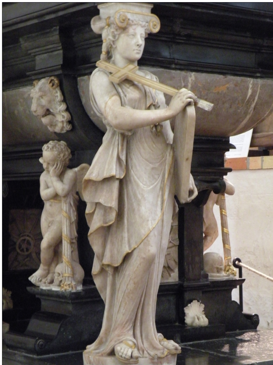
Il. 8. Cornelis Floris z warsztatem, Fides , 1551–1553, figura z nagrobka króla Fryderyka I, Schleswig, katedra