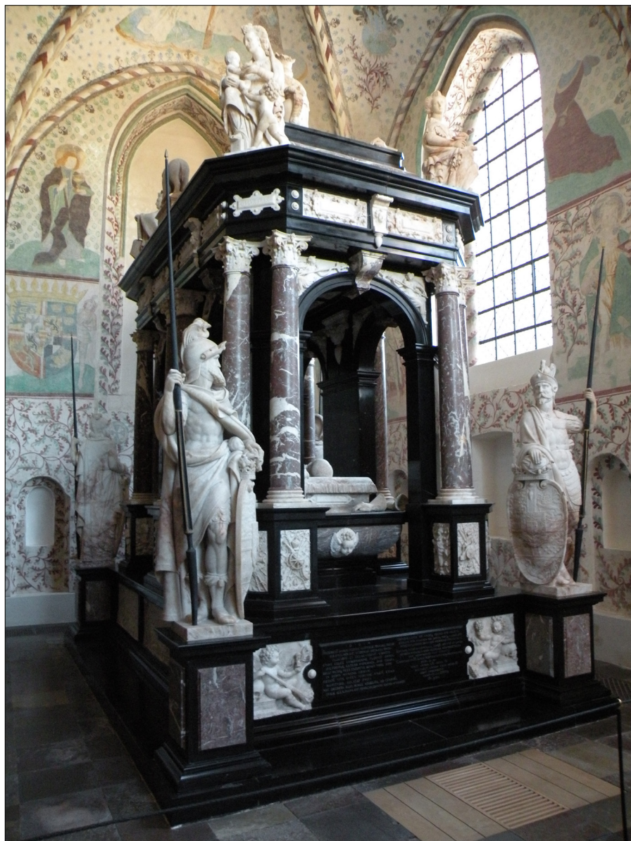
Il. 6. Gert van Egen z warsztatem, nagrobek króla Fryderyka II, 1594–1598, Roskilde