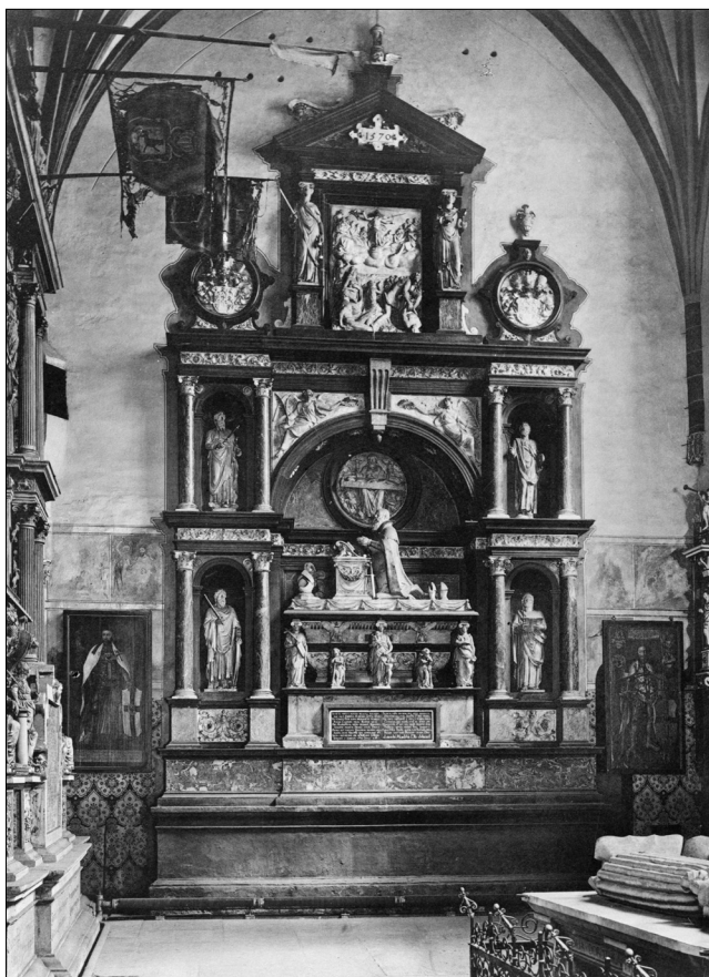
Il. 7. Cornelis Floris z warsztatem, nagrobek księcia Albrechta, 1568–1571, Królewiec, katedra