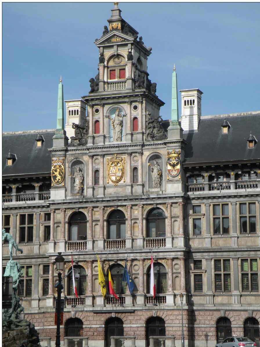
Il. 5. Cornelis Floris, Willem van der Broecke zw. Paludanus i inni, ratusz w Antwerpii, 1560–1565, środkowy ryzalit fasady głównej