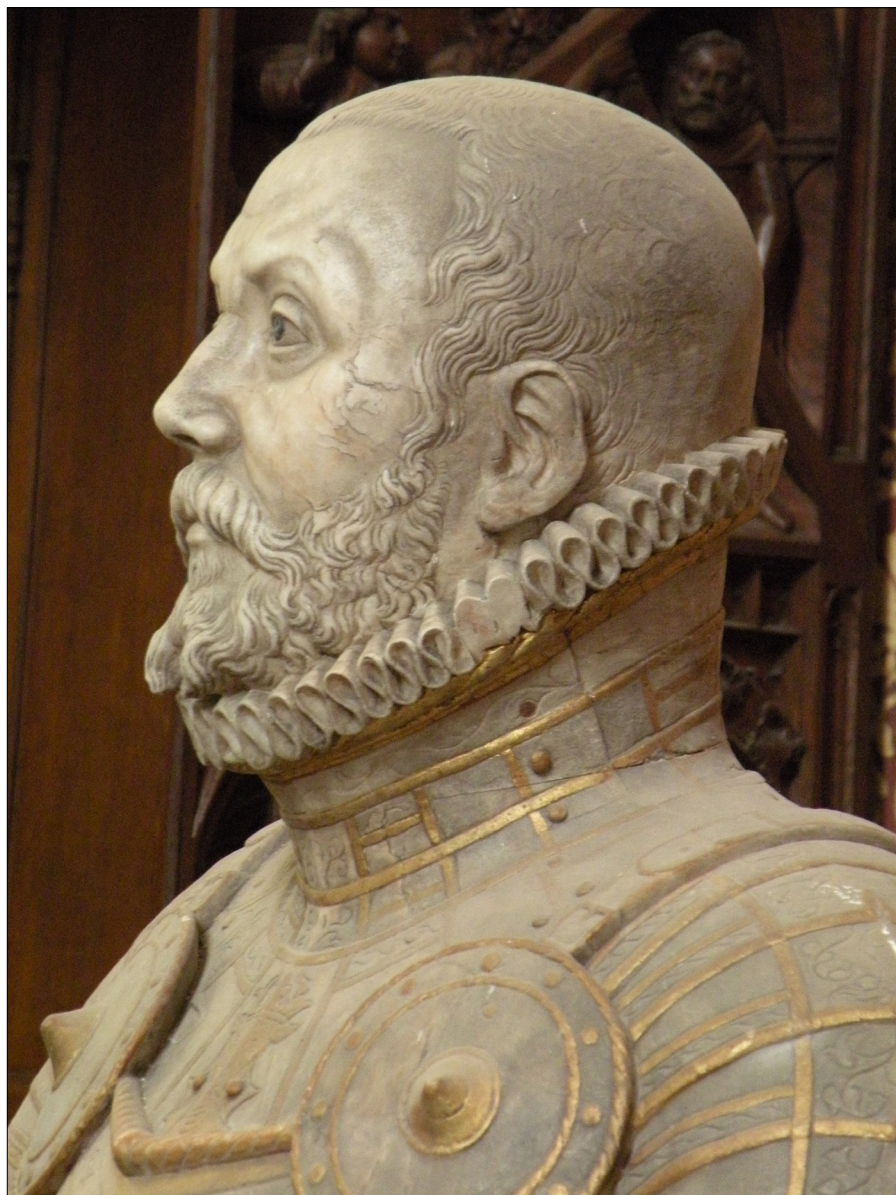
Il. 10. Philip Brandin z warsztatem, figura nagrobna księcia Ulryka (fragment), 1583–1585, Güstrow, katedra