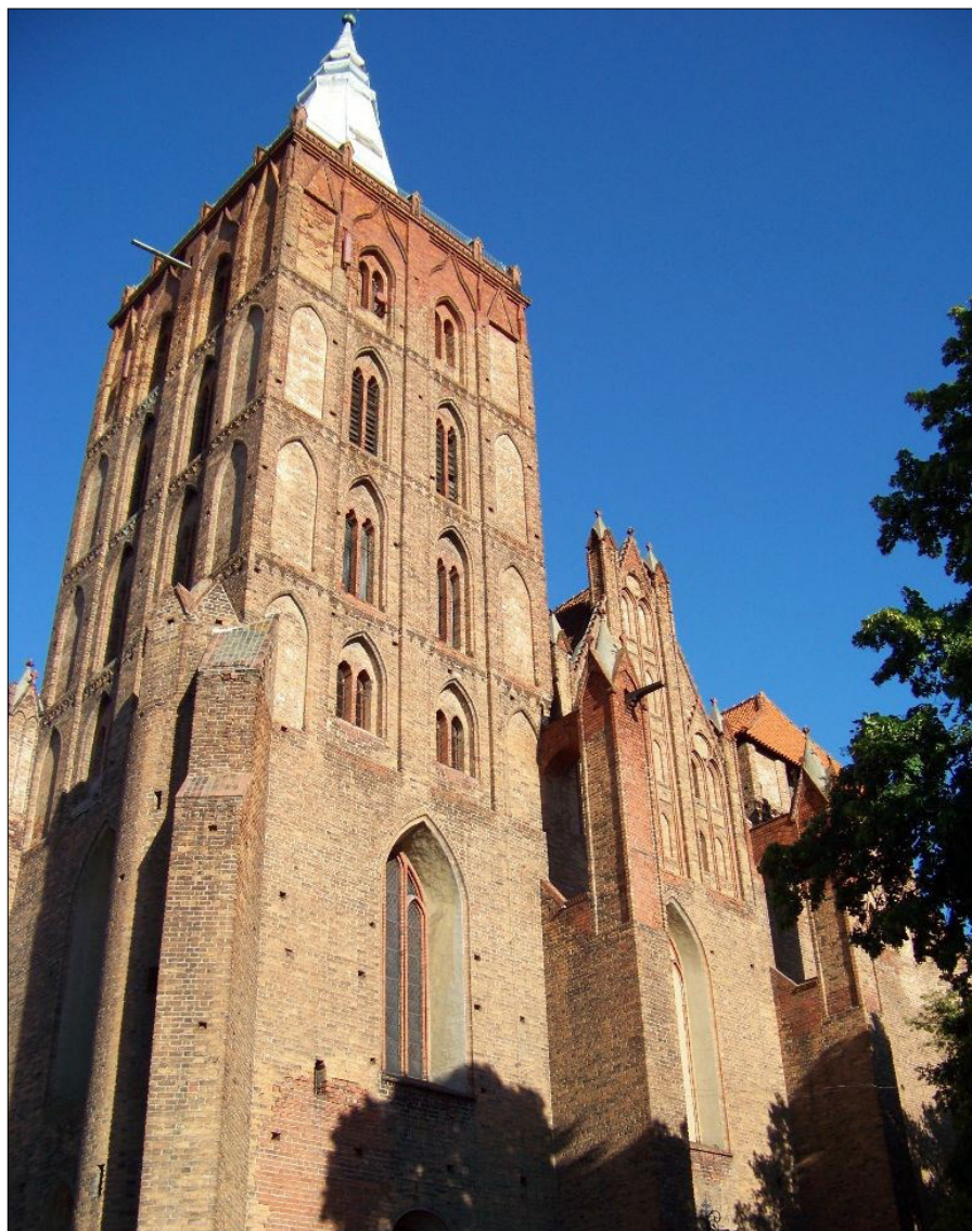
Il. 5. Chełmno, kościół parafialny NMP, fasada zachodnia