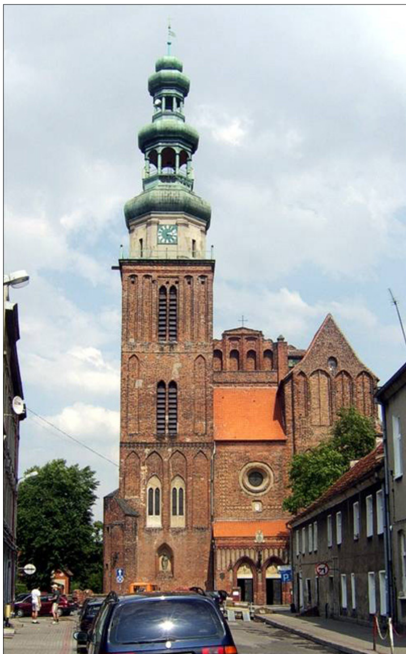
Il. 6. Chełmża, katedra fasada zachodnia