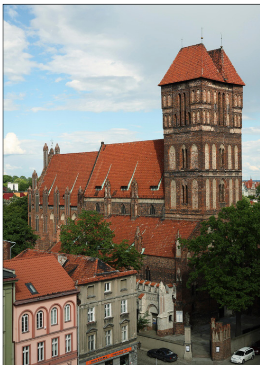
Il. 10. Toruń, kościół św. Jakuba, bryła