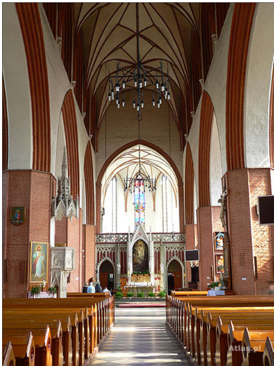
Il. 2. Kwidzyn, katedra NMP i św. Jana Ewangelisty, http://www.atlas.pl/kwidzyn_katedra-jana-ewangelisty-nawa-glowna.html (29.09.2013)