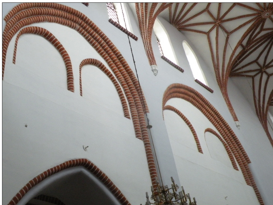
Il. 1. Bartoszyce, kościół parafialny św. Jana Ewangelisty, ściana międzynawowa, fot. J. Jakutowicz, http://www.kolomedievi.umk.pl