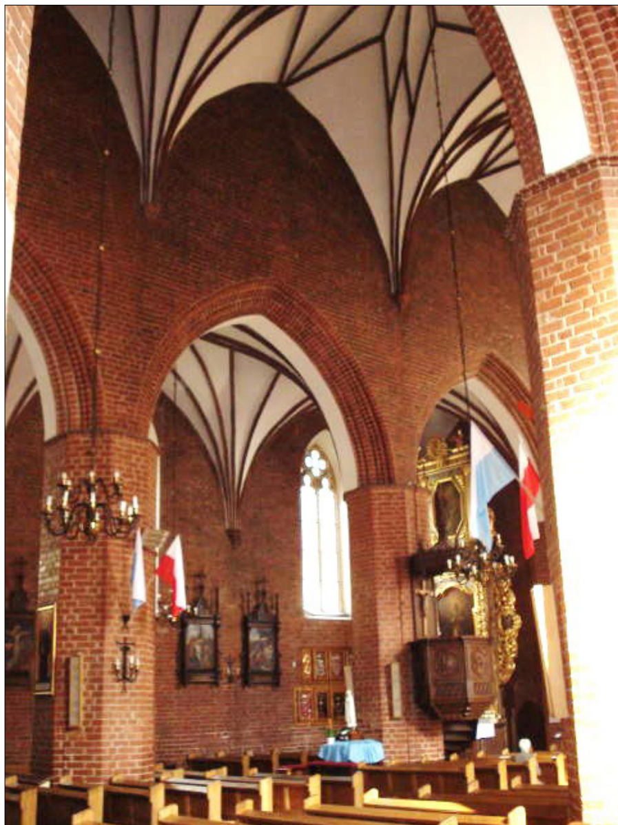
Il. 3. Grudziądz, kościół parafialny św. Mikołaja, wewnątrz