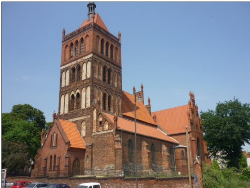
Il. 8. Chelmża, kościół parafialny św. Mikołaja, fasada zachodnia