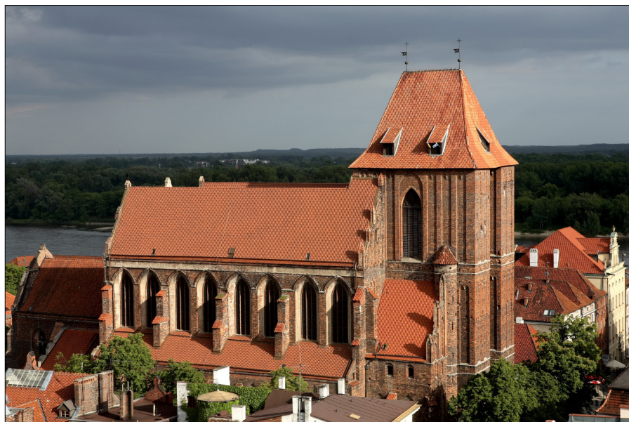
Il. 11. Toruń, kościół św. Jana, fot. A. Skowroński