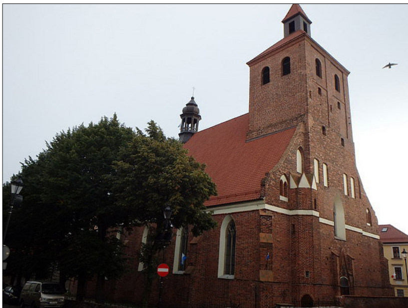
Il. 9. Grudziądz, kościół parafialny św. Mikołaja, masyw zachodni, fot. L. Krantz-Domasłowska.