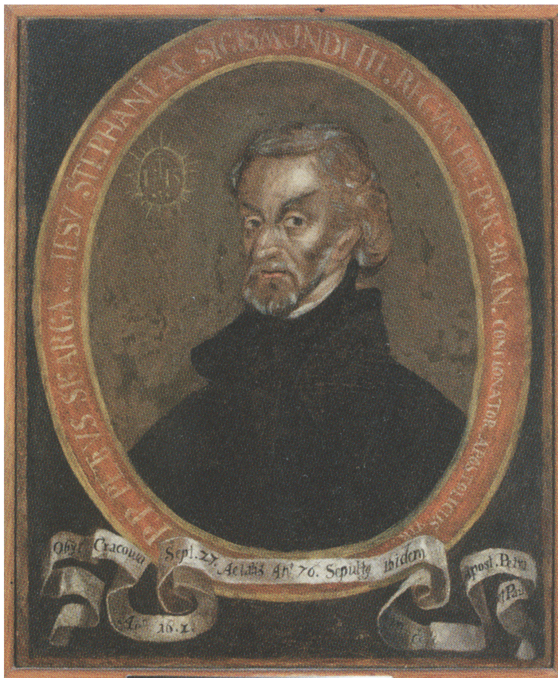
Portret Piotra Skargi, olej na płótnie, 87 x 72 cm, I poł. XVIII w., MNW (MP 4913)