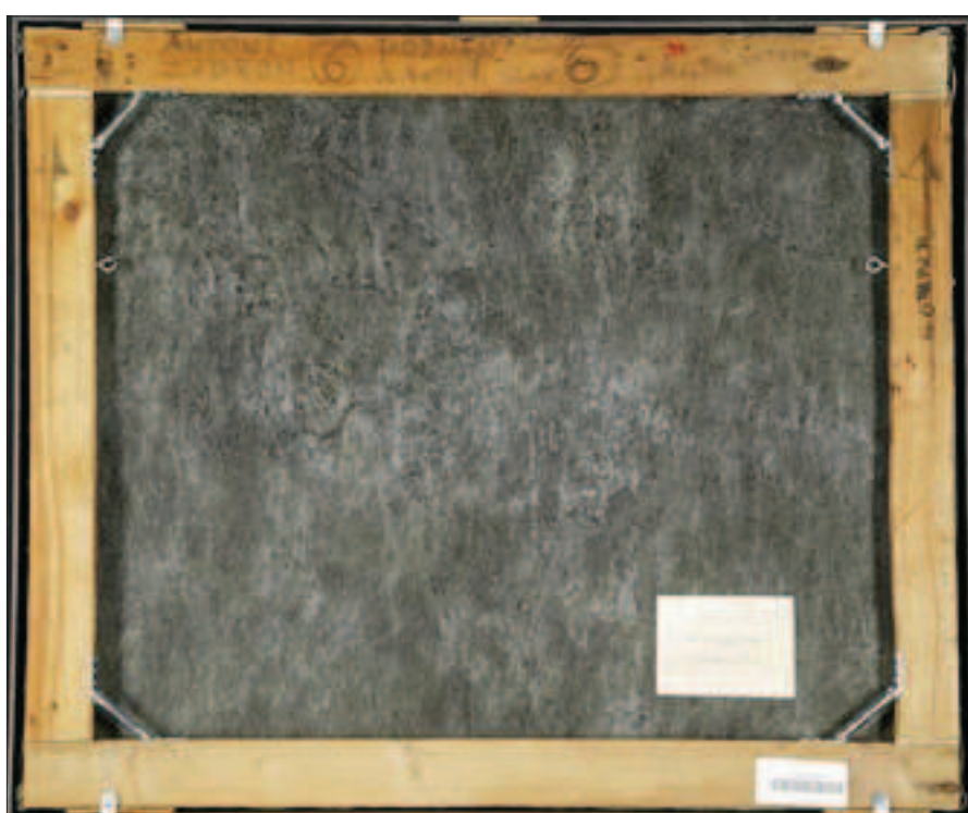
Il. 6. Odwrocie obrazu po zakończeniu prac konserwatorskich