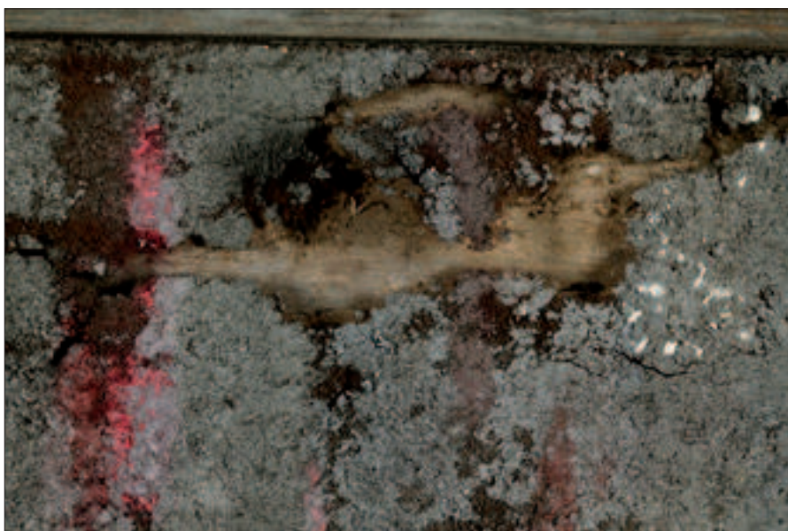
Il. 4. Ubytek warstwy malarskiej wraz z podłożem