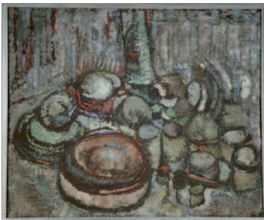
Il. 5. Lico obrazu po zakończeniu prac konserwatorskich