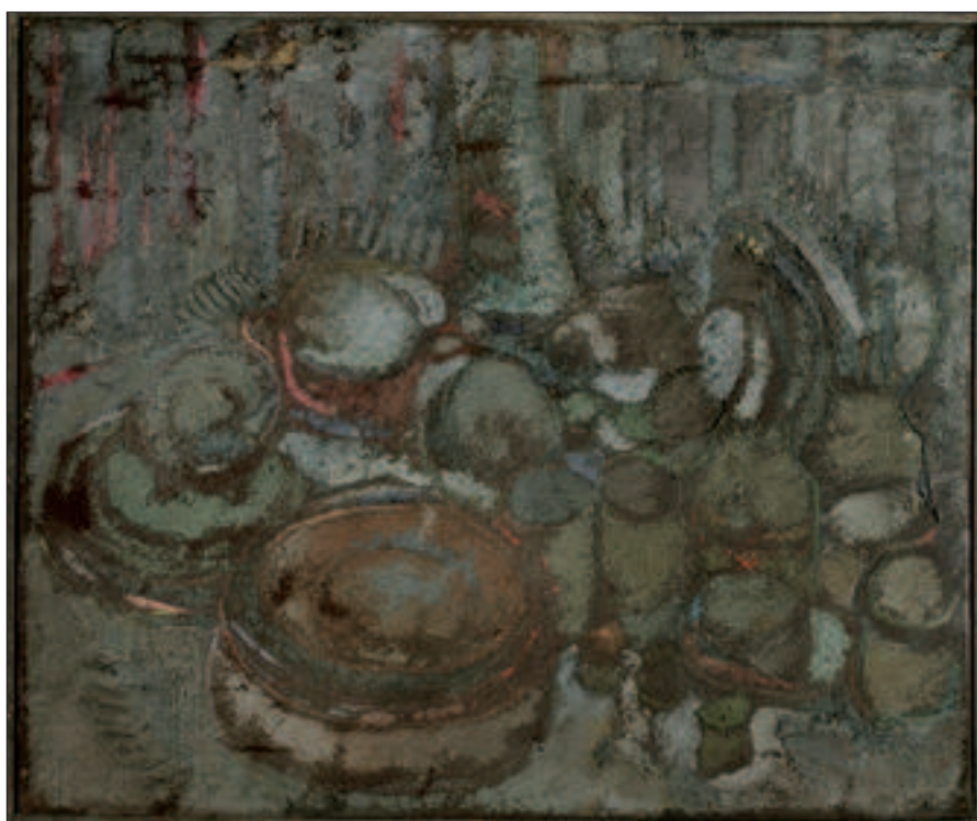
Il. 1. Lico obrazu przed rozpoczęciem prac konserwatorskich