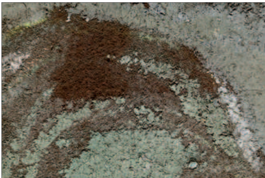
Il. 3. Osypywanie warstwy malarskiej – zbliżenie ubytku