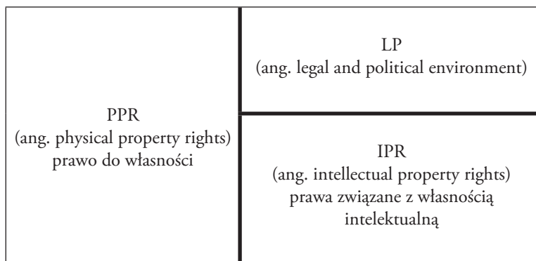
Rysunek 1. Składowe międzynarodowego wskaźnika poszanowania własności

Innym wskaźnikiem, który jest rzadziej wykorzystywany w opisie stanu rozwoju społeczeństwa informacyjnego jest poziom przestrzegania praw związanych z własnością intelektualną. Na użytek międzynarodowych porównań wprowadzono m.in. indeks poszanowania własności (ang. International Property Rights Index – IPRI). Składowe tego złożonego wskaźnika przedstawiono na rysunku 1., podczas jego wyznaczania bierze się pod uwagę ocenę obowiązującego w danym państwie prawa do własności, poziom ustanowionych praw związanych z własnością intelektualną oraz uwarunkowania polityczne i prawne.